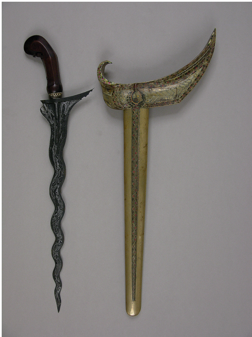
Il. 2. Przykład krisa z Jawy, Jawa Środkowa, Surakarta (Solo), XIX w., nr inw. MAiP 17990. Rękojeść typu nunggak semi (pączkujący pień), łódka w fantazyjnym typie ladrang w odmianie Solo