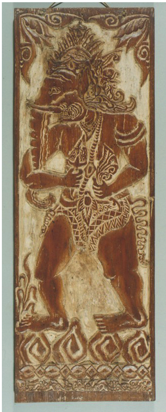
Il. 7. Tablica do zawieszania krisa z reliefem przedstawiającym hinduskiego boga dobrobytu – Ganeśę, syna Śiwy, Indonezja, Jawa, 2. poł. XX w., nr inw. MAP16480