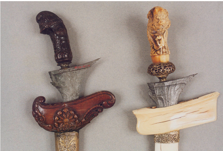
Il. 5. Po lewej stronie kris z Madury z rękojeścią zdobioną motywami z europejskiego munduru, pocz. XX w., nr inw. MAiP 70; po prawej kris z Madury (rękojeść – nunngak semi , pączkujący pień) z pochwą z Sumatry; XIX–XX w., nr inw. MAiP 14058; fot. Eugeniusz Helbert (MAiP)