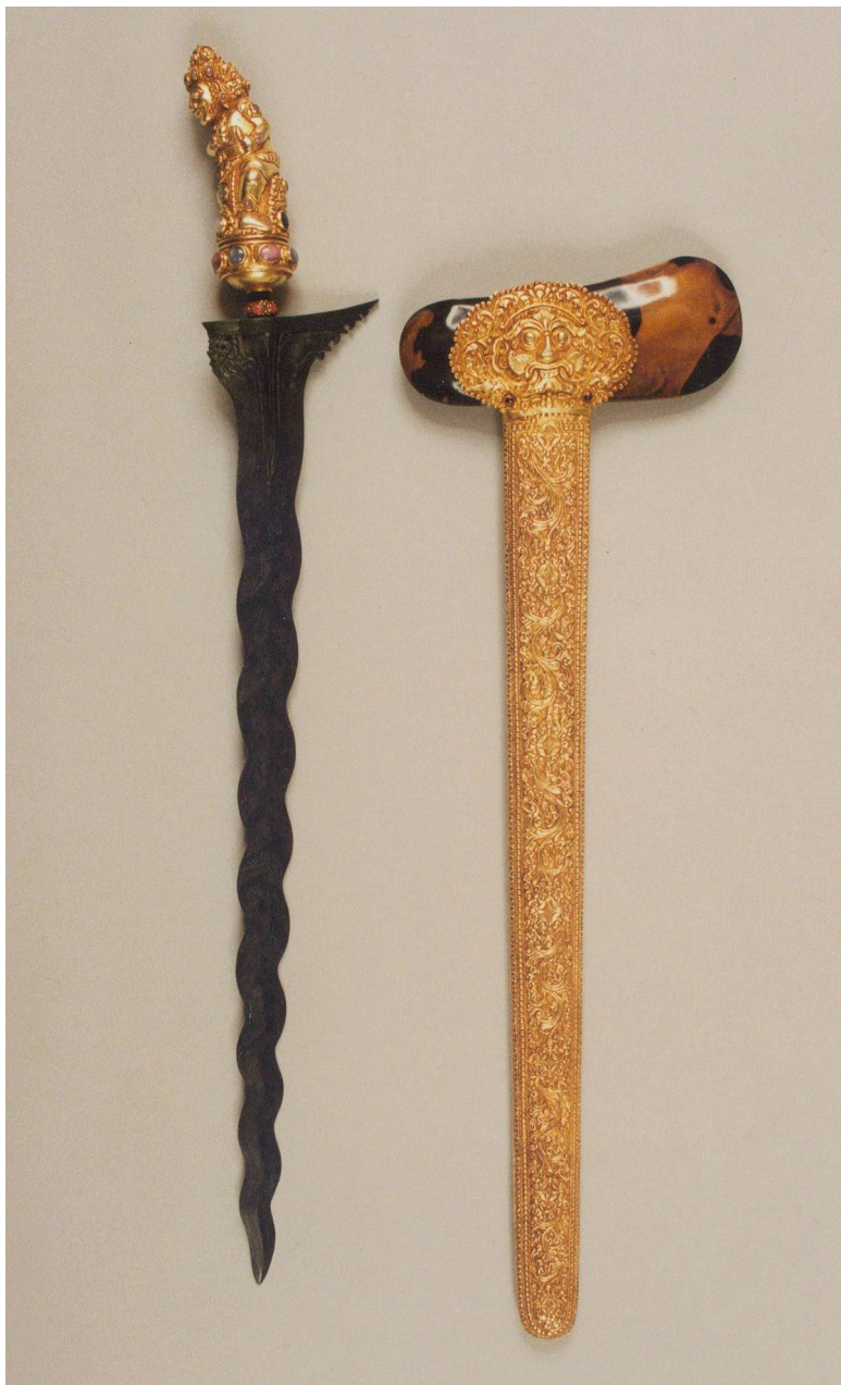
Il. 3. Kris z Bali. Rękojeść antropomorficzna, łódka typu gayaman Bali , okucie typu topengan (z maską Kali, władcy czasu), XIX w., nr inw. MAiP 17160