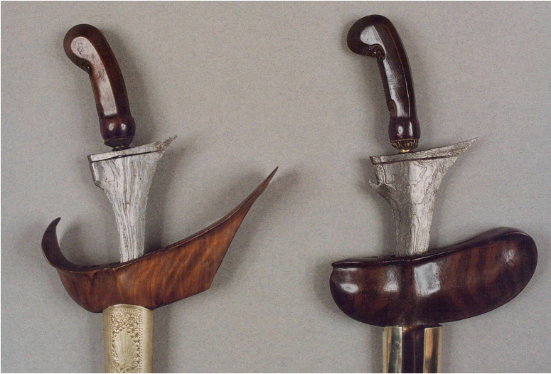
Il. 4. Dwa krisy z Yogykarty (Yogya) na Jawie Środkowej – porównanie. Po lewej kris z łódką typu ladrang Yogya; po prawej z łódką gayaman Yogya; oba krisy pocz. XX w., nr inw. MAiP 365 i 39; fot. Eugeniusz Helbert (MAiP)