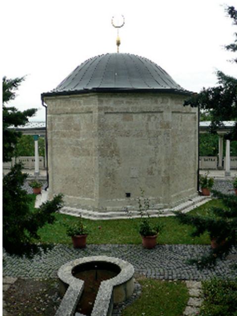
Il. 7. Kompleks grobowy Gül Baby w Budapeszcie, fot. E. Marcinkowska.