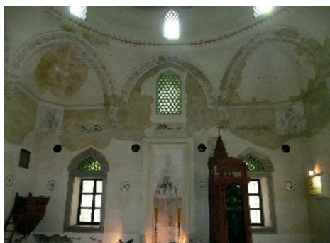
Il. 5. Dekoracyjne wnętrze meczetu Jakováli Hassana Paszy w Pécs-u, fot. E. Marcinkowska.