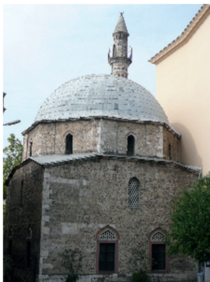
Il. 4. Meczet Jakováli Hassana Paszy w Pécs-u, fot. E. Marcinkowska.