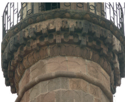
Il. 6. Podstawa galerii minaretu w Egerze, fot. E. Marcinkowska.