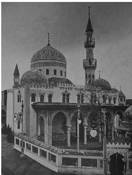
Il. 2. Meczet na starym zamku w Budapeszcie, fotografia z 1896 r., ( Ungarn zur Zeit des Millennium. Ein Album mit zeitgenössischen Fotografien , Budapest 1996, s. 147.)