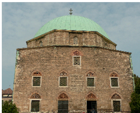
Il. 3. Dawny meczet Paszy Gazi Kasima w Pécs-u. Obecnie kościół katolicki