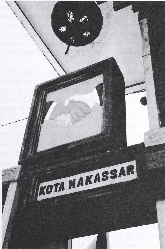
Abb. 5: Transethnische Begegnung vs. scharfe Kategorien: Schild am Eingang der „Chinatown“ Makassars