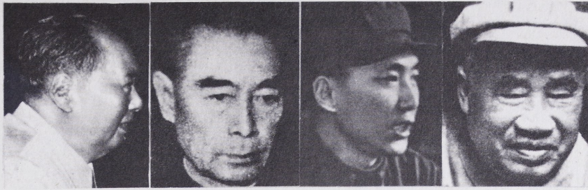
Mao Tse tung