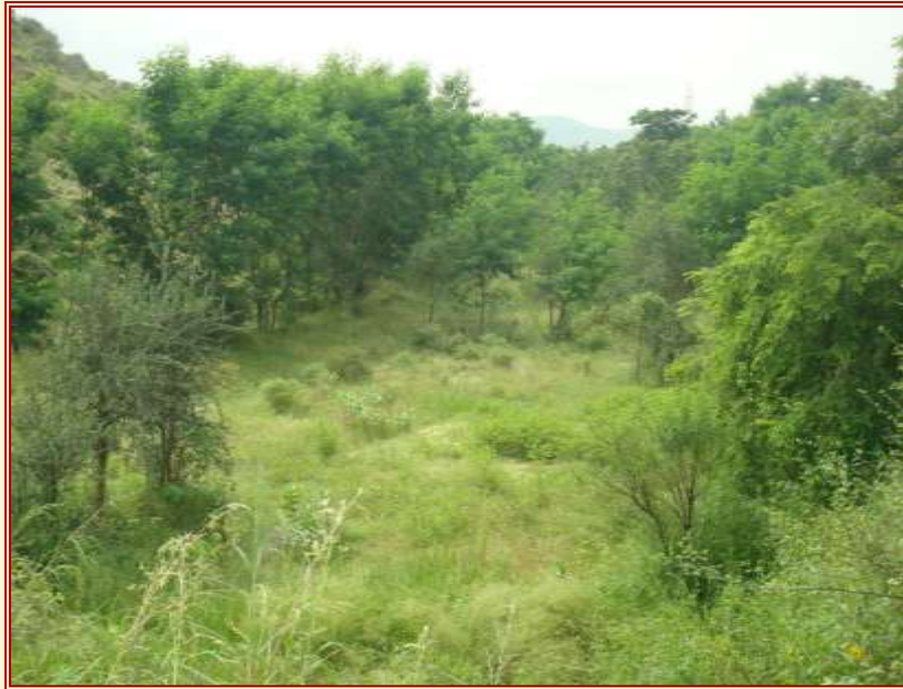
Abb. 2: Gandhivan

Sichtbares Herzstück der GBS ist der Gandhivan, „Gandhi-Wald“ (Abb. 2). Er wurde seit 1991 einem Areal von 25 ha Sanddünen abgerungen. Der Boden wurde durch geeignete Bäume und Sträucher gebunden, schnellwachsende Gehölze für die Brennholzgewinnung (durch Sammeln, nicht durch Abholzen), Futterpflanzen und heimische Baumarten sowie wirtschaftlich relevante heimische Fruchtgehölze wurden angepflanzt.