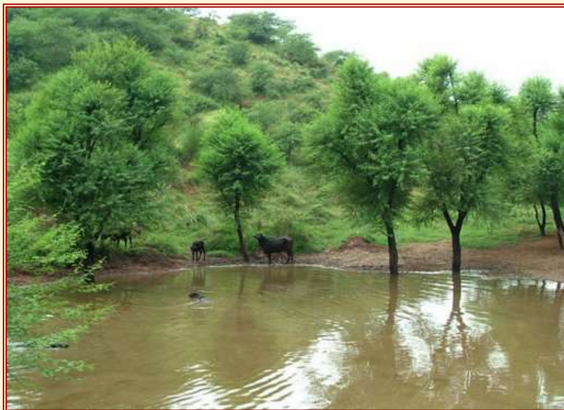
Abb. 3: See im Gandhivan

Das Wasser wurde durch Kanäle und Seitenrinnen durch die Pflanzungen geleitet, um Abschwemmungen zu unterbinden, und ein kleiner See wurde aufgestaut als Tränke für Nutzvieh und Wild (Abb. 3).