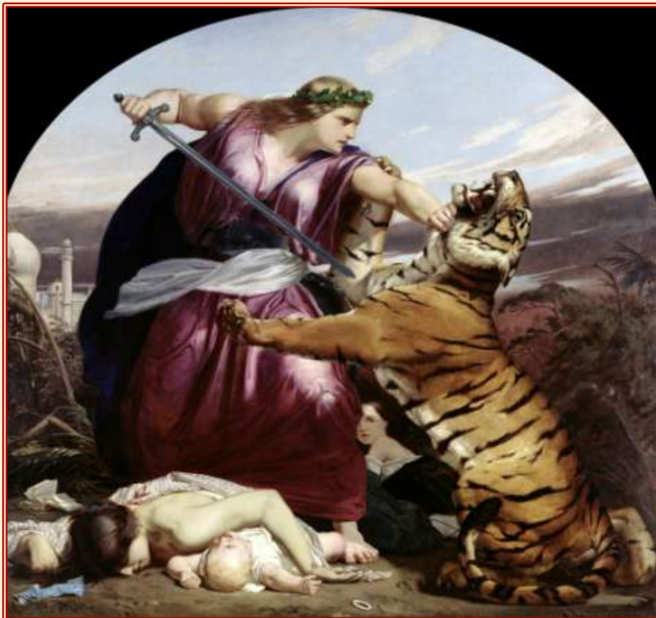
Abb. 1: Retribution , 1858 (oil on canvas), Armitage, Edward (1817-96) Leeds Museums and Galleries (Leeds Art Gallery) U.K. / The Bridgeman Art Library

In Edward Armitage's oil painting Retribution (1858), we see Britannia personified by a woman of extremely masculine appearance, sturdily built, with muscular arms and a strong, well-defined jaw. In this violent scene, it is Britannia who wields the only weapon – a sword, representing British supremacy and productivity, emblazoned with a crucifix, standing for Christianity.