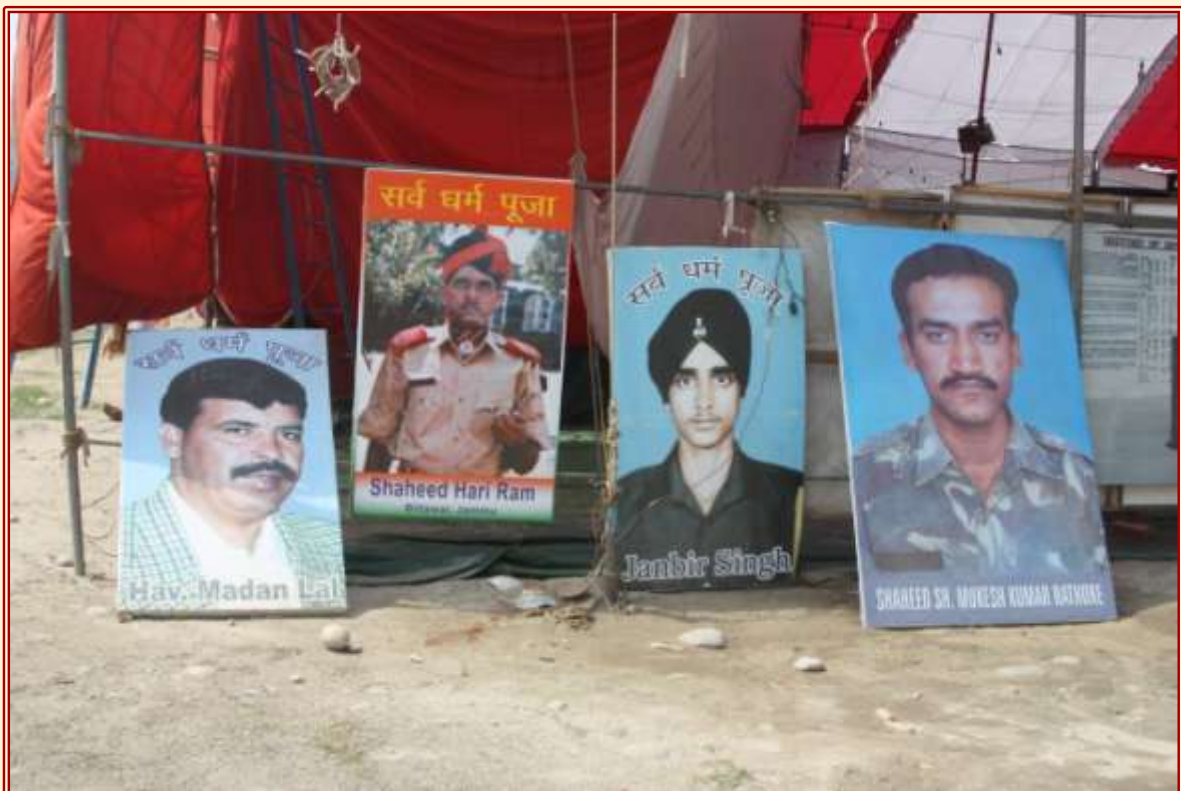
Abb. 2: Ausstellung am Rande des Opferplatzes mit Bildern im Kargil Krieg gefallener Soldaten