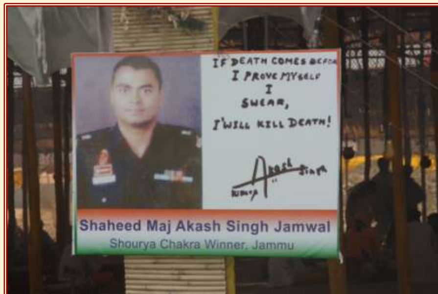
Abb. 3: Abbildung eines gefallenen Soldaten am Eingang der Opferstätte ( yajñśālā )

In einer Abendveranstaltung, die an eine der Opferzeremonien anschloss, wurden die hinterbliebenen Mütter und Witwen geehrt. Die Veranstaltung hatte das vordergründige Ziel für diese Familien Spendengelder zu akquirieren. Tatsächlich sollte sie jedoch die Bedeutung des Opfers propagieren. Während die Frauen gefeiert wurden, da sie ihre Söhne und Ehemänner für die Hindunation opferten, wurden die Soldaten als Märtyrer stilisiert, die bereitwillig ihr Leben ließen, um die Grenzen des Landes zu verteidigen (Abb. 3).