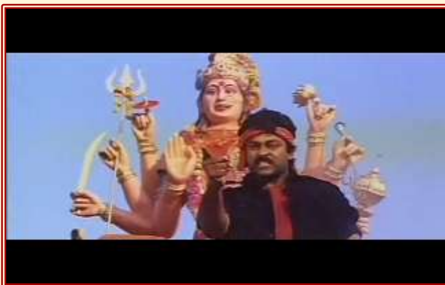
Abb. 1: Filmszene aus Mutha Mestri (1993)

Damit wissen die Zuschauer schon vor dem actionreichen Spektakel des „final fight“, dass Bose gegen die Überzahl der bewaffneten Männer Aatmas klar im Vorteil ist: In seinem Kampf für Tradition, Gerechtigkeit und Demokratie verkörpert der junge Held den gerechten Zorn der Nation und der Götter. Dieser Zorn macht unbesiegbar – zumindest auf Indiens Kinoleinwänden seit Mitte der 1980er Jahre.