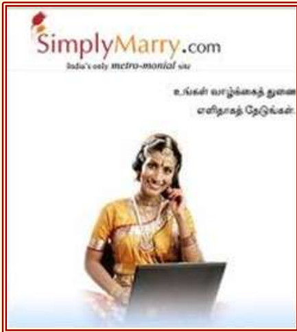
Abb. 3: Die „New Indian Woman“ als Verbindung von Tradition und Moderne. Screenshot der Matrimonial website SimplyMarry.com auf Tamil (Mai 2010)

In einer durch fortschreitende Globalisierung veränderten weltpolitischen Situation ist es weiterhin die „New Indian Woman“, die gleichzeitig die kulturelle Essenz Indiens und seine Anpassungsfähigkeit an eine globale Moderne verkörpert. 7 An diese Diskurse anknüpfend wird untersucht, wie zirkulierende mediale Repräsentationen auf Design und Nutzung indischer Online-Heiratsportale reflektieren.