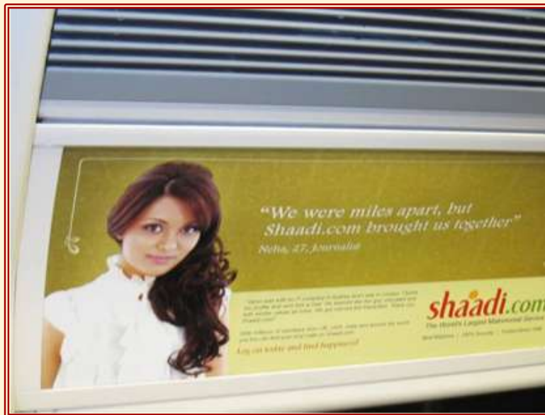
Abb. 2: Das indische Online-Heiratsportal Shaadi.com wirbt in der Londoner U-Bahn mit dem Slogan „We were miles apart, but Shaadi.com brought us together“ (August 2010)

Es ist sogar anzunehmen, dass optimierte technische Möglichkeiten zu einer Verstärkung dieser führen können. Diese Ausdifferenzierung erstreckt sich weit über die geografischen Grenzen der Republik Indien hinaus und durchdringt auch den transnationalen Raum. 5