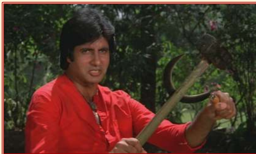
Abb. 3: Filmszene aus Coolie (1983)

Der Kult um den Zorn und die Wiederholung erfolgreicher Filmplots führt schließlich auch zu einer Stereotypisierung des angry young man und des angry mass hero . War Zorn in Filmen wie Zanjeer (1973) oder Khaidi (1983) als sehr komplexer Gefühlszustand und emotionales Leiden konzeptualisiert, zeigen Filme wie Mutha Mestri (1993) oder Coolie (1983, Kofferträger) Zorn als einen heroischen männlichen Stil. „Anger“ als „Style“ beruht auf lässiger Kleidung, Körperbeherrschung, Muskeln, den verbal schlagkräftigen „ punch dialogues “ und patriotischer Hingabe. Als Stereotyp wird der angry young man eine Leitfigur populistischer Film-rhetorik, wenn etwa der Kofferträger Iqbal ( Coolie , 1983) in traditioneller roter kurta Hammer und Sichel gegen den westlich gekleideten Millionärssohn erhebt.