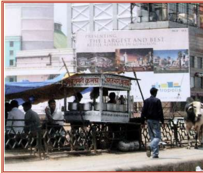
Abb. 1: Ahuja/Brosius: Mumbai, Delhi, Kolkata (2006)

„Denn sie [die Großstadtliteratur] beabsichtigt nicht weniger, als dass ihre jeweilige Darstellungsweise die Großstadt mit einem umfassenden Gestus einholt, selbst wenn die Darstellung selbst nur aus Einzelbildern besteht.“ 1