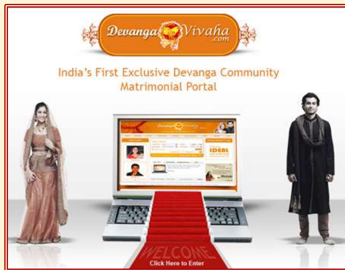
Abb. 1: Kastenspezifisches Online-Heiratsportal http://devangavivaha.com (03.12.2012)

Auch die Frage danach, wie sich die indischen matrimonial websites zu Hierarchien wie Religion, Kaste, Klasse und Geschlecht verhalten, die alle als Kategorien mehr oder weniger explizit in den Nutzerprofilen enthalten sind, findet Berücksichtigung in meinem Forschungsdesign.