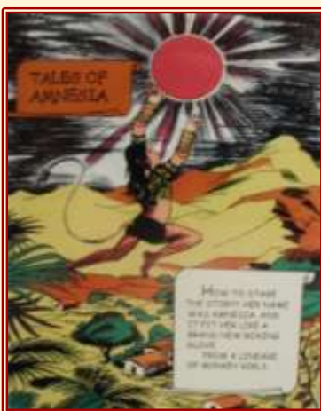
Abb. 1: Chitra Ganesh's Tales of Amnesia

For example, Chitra Ganesh's Tales of Amnesia takes up the extremely popular Indian comics called Amar Chitra Katha which function as educational story-tellers, the comics relate tales from Indian mythology (e.g. from the Ramayana and Mahabharata ), Hindu religion and history, in straightforward patriarchal narratives centering on heroic male figures of Gods and heroes. The comics form the backdrop of her partially hand drawn, partly digitally photo-shopped portfolios of prints in which mythological tales are transformed into queer feminine fables, male figures mysteriously disappear and the all women scenarios sport references across histories and cultures, from Sappho to Sita to Roxanne and Sati in tableau like collages - traditional images from history and mythology jostle with images of bare bosoms and naked bodies indulging in queer sexual pleasuring. In other words, the absent feminine body of an Indian mythological past is now centre stage with her own desires and sexual proclivities.