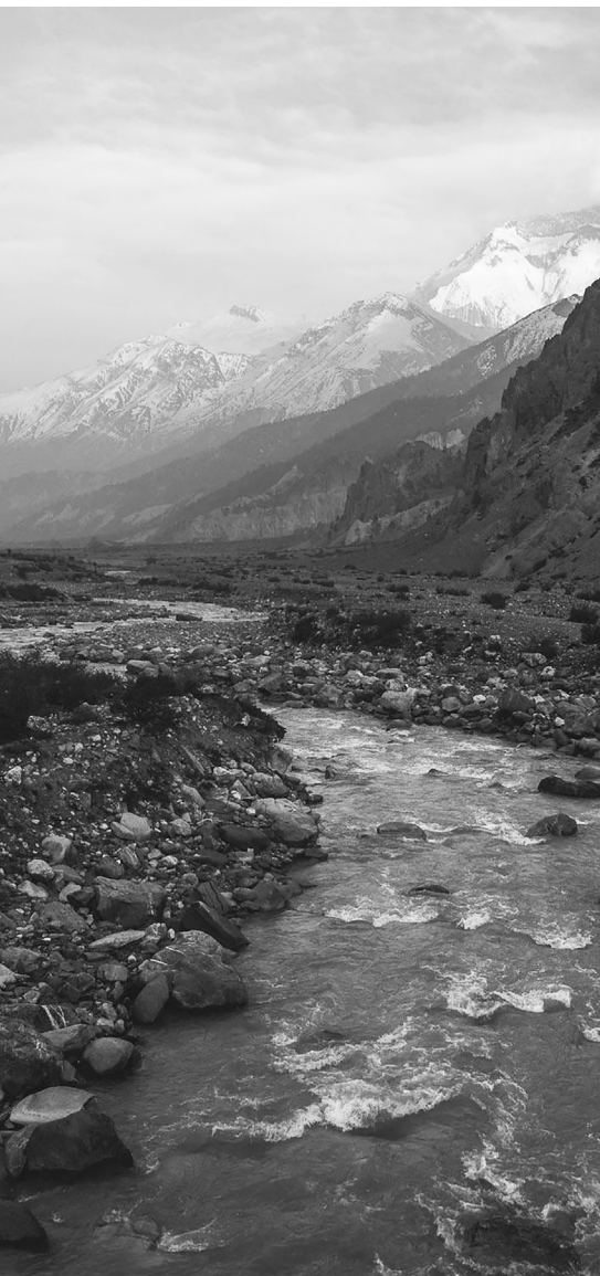
Der Fluß Marsyangdi.