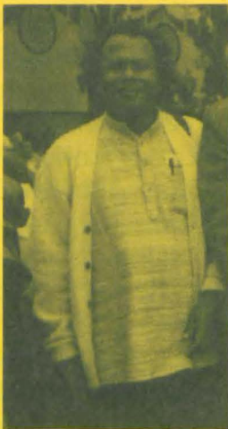
Ram Dayal Munda im Jahr 1993. Am 30. September 2014 jährt sich sein Todestag zum dritten Mal.

Die unerträgliche Qual dieses Fortschritts werde ich nicht lange auszuhalten haben. Bevor meine Zeit um ist, werden sie mich vielleicht schon fertig gemacht haben.