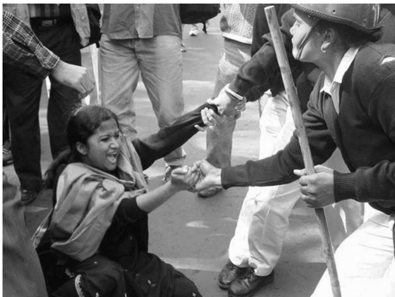
Festnahme einer Demonstrantin, die in Kalkutta gegen die Tötung von Dorfbewohnern beim Kampf um die Einrichtung einer Sonderwirtschaftszone in Nandigram, Westbengalen, protestiert.

Zudem forderten mehrere Staaten Indien zur Ratifizierung der ILO-Konventionen 138 „Über