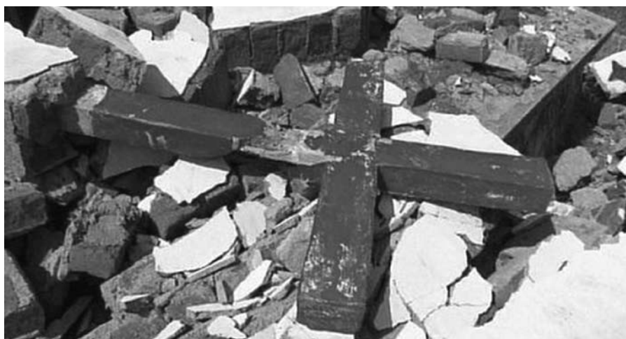
Zerstörung einer Kirche bei antichristlichen Ausschreitungen in Orissa.

Hilfe werden Staudämme, Industriekomplexe, Bergbau- und Militäranlagen errichtet, wodurch Millionen von Adivasi zumeist ohne Entschädigung vertrieben werden. So wurden die Pläne der indischen Regierung, in Gebieten der Stammesgemeinschaften Sonderwirtschaftszonen einzurichten, die es Privatfirmen erleichtern, dort Rohstoffe zu fördern und Industrieanlagen aufzubauen, mit dem Hinweis auf eine anwachsende interne Vertreibung heftig kritisiert.