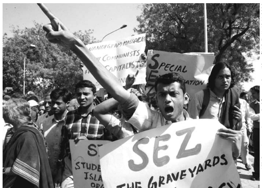
Proteste in Delhi wegen der Tötung von Dorfbewohnern beim Kampf um die Einrichtung einer Sonderwirtschaftszone in Nandigram, Westbengalen (2007).