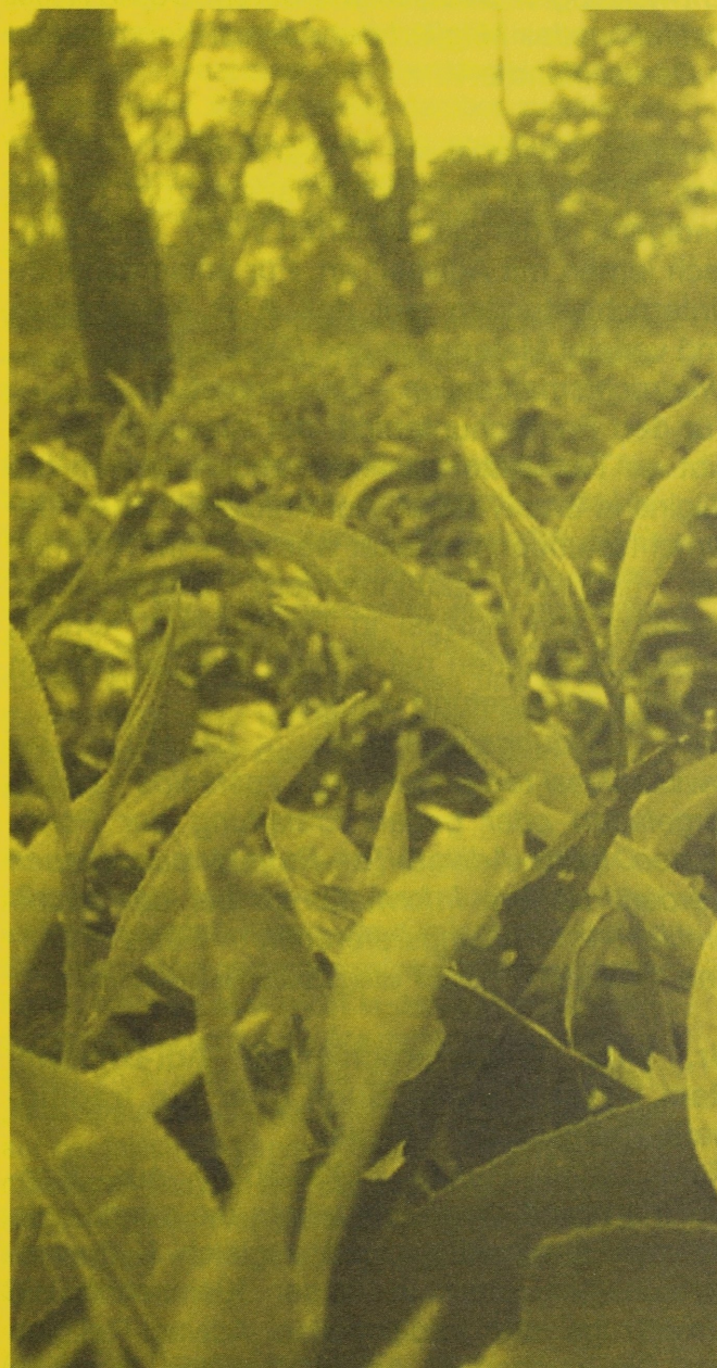
Teeplantage in Assam.

Times of India , 19.5.2015 "6 Assam Tribes may soon get Scheduled Tribes status"; The Assam Tribune 16.5.2015: "Adivasi team's push for S status".