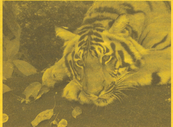
Die Adivasi vom Volk der Baiga haben für Generationen mit dem Tiger gelebt und betrachten ihn als ihren „kleinen Bruder“.

Presseerklärung von Survival International vom 22. Juli 2015