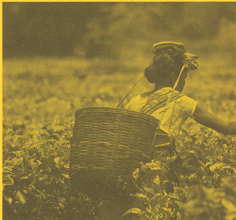
Auf einer Teeplantage in Assam.