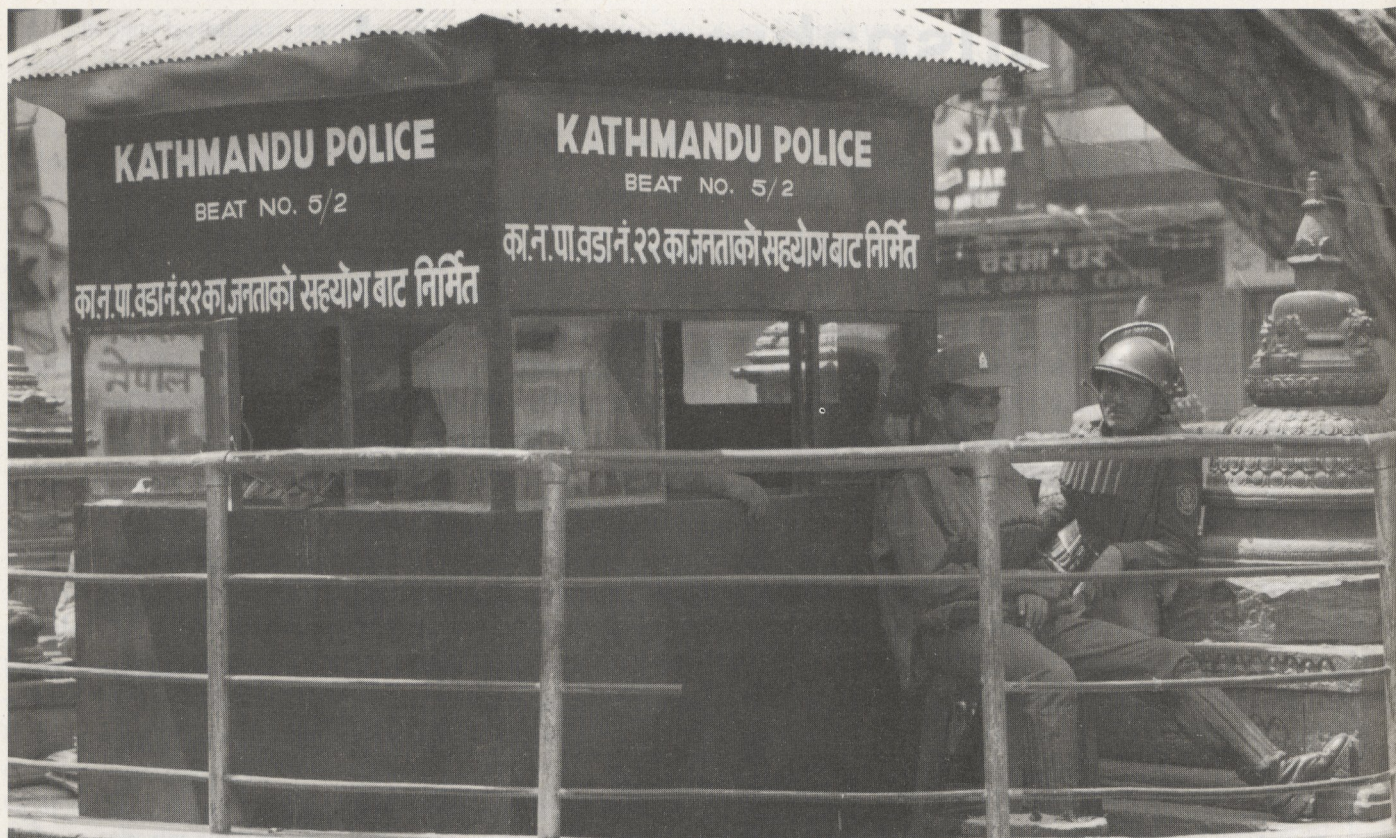
Nepal im Bürgerkrieg: Kontrollposten in der Hauptstadt

Die Maoisten hatten in der etwa viermonatigen Verhandlungsphase diverse Zugeständnisse gemacht. So waren sie zumindest vorerst mit dem Fortbestand der Monarchie einverstanden gewesen und verzichteten folglich auf die sofortige Einführung einer Republik. Bestanden hätten sie jedoch bis zuletzt auf allgemeinen Wahlen zu einer verfassungsgebenden Versammlung, die dann eine neue Verfassung ausarbeiten sollte. Die bestehende Verfassung wurde als undemokratisch kritisiert, weil sie 1990 von selbsternannten Volksvertretern geschaffen wurde. Jene Parteiführer hätten keinen repräsentativen Querschnitt der nepalischen Gesellschaft dargestellt, sie seien nie vom Volk gewählt und somit legitimiert gewesen und sie hätten es nicht einmal für nötig befunden, die von ihnen entworfene Verfassung durch ein Volksreferendum absegnen zu lassen.