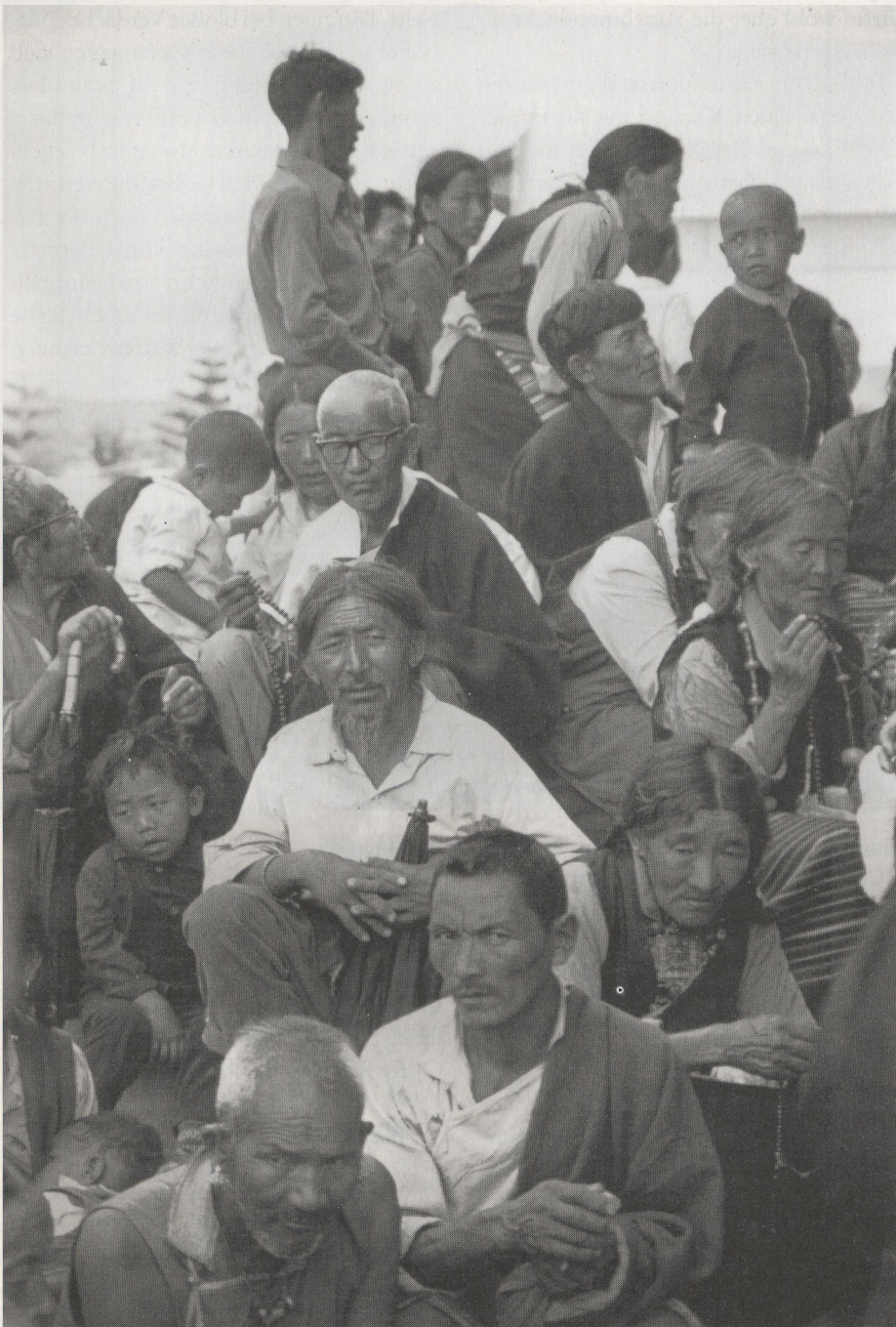
Bevölkerung sieht schweren Zeiten entgegen

Dollar für derartige Zwecke zur Verfügung stellen.