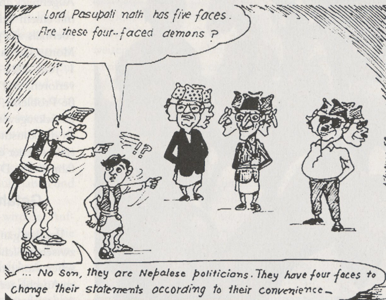
Wendehalspolitiker sind für die Eskalation des Bürgerkrieges mitverantwortlich (Cartoon aus einer nepalesischen Tageszeitung)

Die Eskalation des maoistischen Konflikts, die Ausrufung des Ausnahmezustands und die Mobilisierung der Armee können nicht losgelöst von der veränderten weltpolitischen Lage nach dem 11. September 2001 betrachtet werden. Zum einen ist die nepalische Regierung auf den amerikanischen Wagen aufgesprungen und hat die Maoisten, mit denen sie noch kurz zuvor am Verhandlungstisch gesessen hat, zu „Terroristen“ erklärt. Im Gegenzug erklärte George Bush Nepal zu einem der kritischen Länder am Rande der von ihm ausgemachten „Achse des Bösen“. In der Folgezeit besuchte mit Colin Powell erstmals ein amerikanischer Außenminister Nepal und bot amerikanische Unterstützung und Beratung bei der Bekämpfung der Terroristen an. Weltweit wollen die Amerikaner 373 Millionen US-