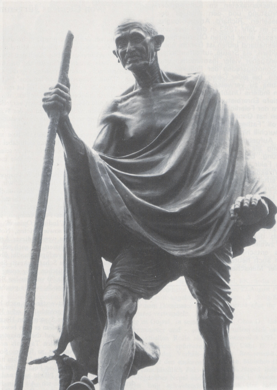
Gandhi-Denkmal in Delhi

größeren Maße, als es ihm selbst bewußt war. Es sind vor allem christliche und liberale Vorstellungen, die Eingang in sein Denken gefunden haben. Namentlich zu nennen wären hier Henry David Thoreau, Leo Tolstoi und John Ruskin sowie die Bergpredigt, die, wie er in seiner Autobiographie schreibt, "recht nach meinem Herzen war". Waren es bei Thoreau das Recht des Individuums auf bürgerlichen Ungehorsam gegenüber dem Staat, bei Tolstoi das Ideal einer