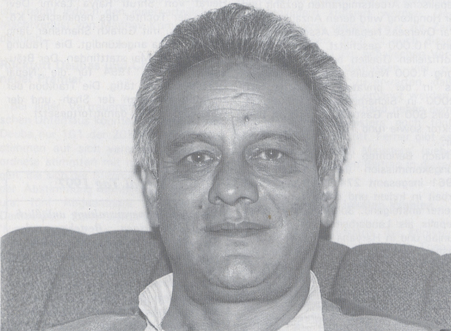
Nepals neuer Premier Chand

Wie ist der neue Premierminister Nepals einzuschätzen? Chand machte im vorletzten Parlament des Panchayat-Systems erstmals von sich reden, als er 1983 den damaligen Premierminister Surya Bahadur Thapa, den heutigen Vorsitzenden der 'National Democratic Party', durch ein Mißtrauensvotum stürzte. Es war dies das erste und einzige Mal, daß von dieser erst nach dem Referendum von 1980 eingeführten Option Gebrauch gemacht wurde. Doch es gab zahlreiche Anhaltspunkte, daß jener Sturz Thapas vom Palast gelenkt wurde. Eine besondere Nähe zum Königspalast ist es auch, was Lokendra Bahadur Chand bis heute nachgesagt wird. Als im April 1990 die Grundfesten der Monarchie durch die demonstrierenden Volksmassen bedroht wurden, war es Chand, auf den König Birendra zurückgriff, um zu retten, was eigentlich schon längst verloren war, nämlich das parteilose Panchayat-Sy-