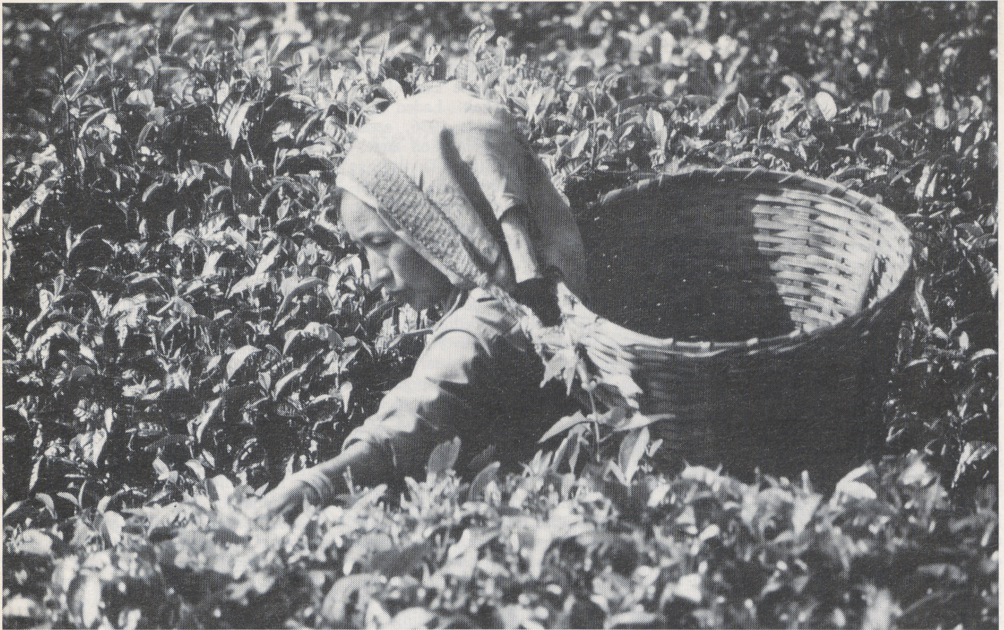
Plantagenarbeiterin im Darjeeling-Distrikt

dum an Jawaharlal Nehru, den Vizepräsidenten der damaligen Übergangsregierung, und an Liaquat Ali Khan, den Finanzminister und Vorsitzenden der Muslim League Assembly Party. Darin forderten sie die Schaffung von Gorkhasthan, einer unabhängigen Nation, die das heutige Nepal, den Darjeeling-Distrikt und Sikkim, ausschließlich seines Norddistrikts, umfassen sollte — allesamt Gebiete mit überwiegend nepalischen Bevölkerungsgruppen. Außer acht gelassen wurde dabei, daß Nepal schon immer ein unabhängiger Staat war, und daß es sich bei Sikkim ebenfalls nicht um indisches Territorium, sondern um ein britisches Protektorat handelte.