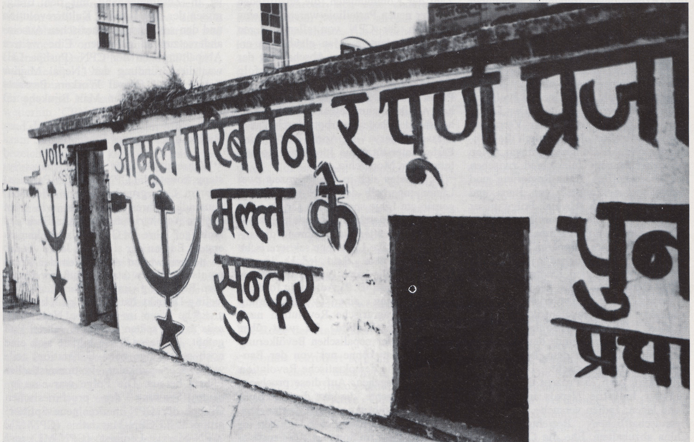
Graffiti der "Linken"

Die Antwort der Polizei war nicht weniger gewalttätig. Bei einem einzigen Zusammenstoß wurden sechs bäuerliche Aktivisten getötet. In Rolpa wurden in neun Dorfwahlkomitees (VDC), wie die lokalen Verwaltungseinheiten heute bezeichnet werden, etwa 1000 Polizisten stationiert. Nach Polizeiangab-