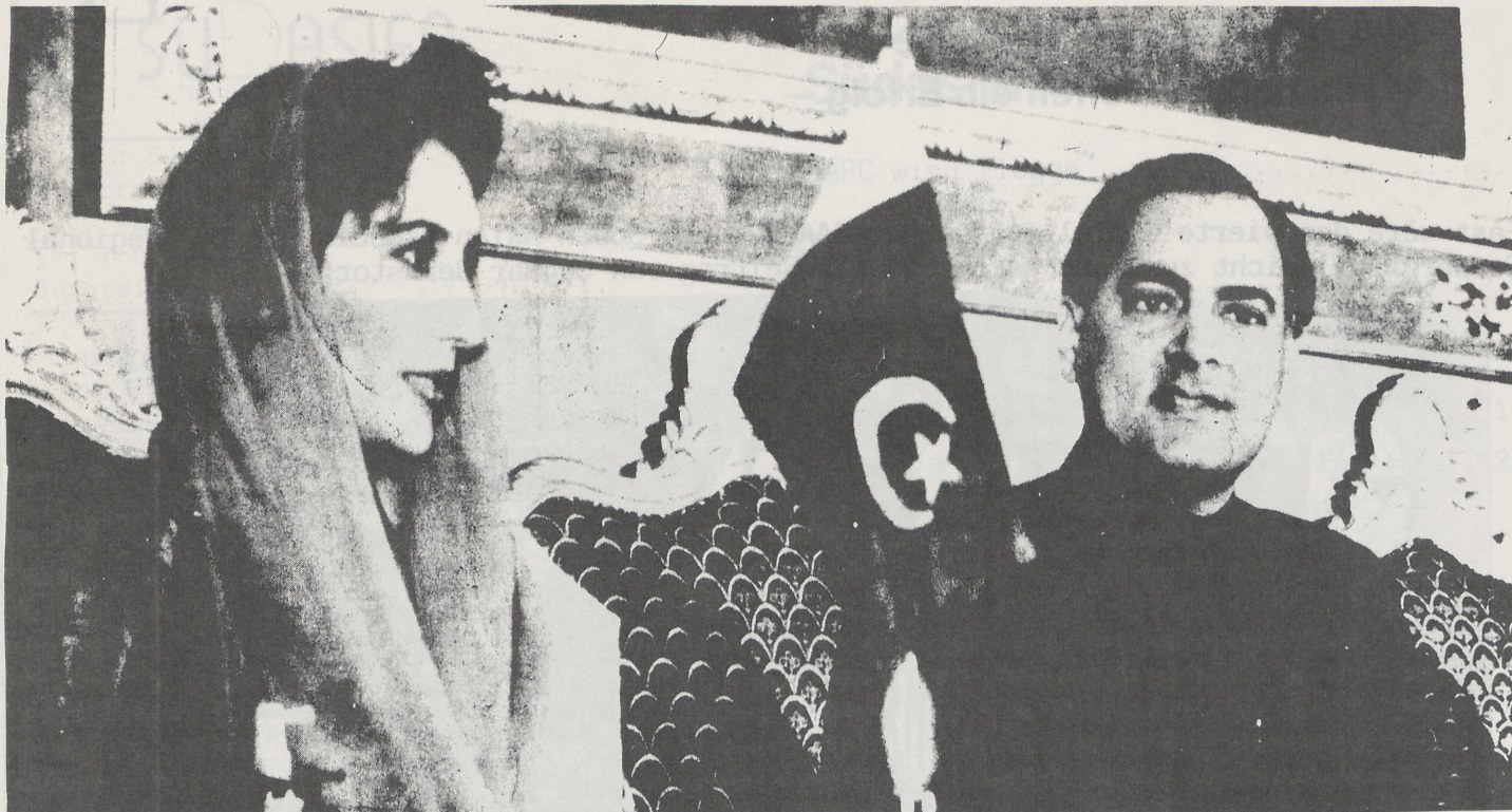
Die "Stars" des SAARC-Meetings: Rajiv Gandhi und Benazir Bhutto

Rajiv: "An guten Beziehungen interessiert..."