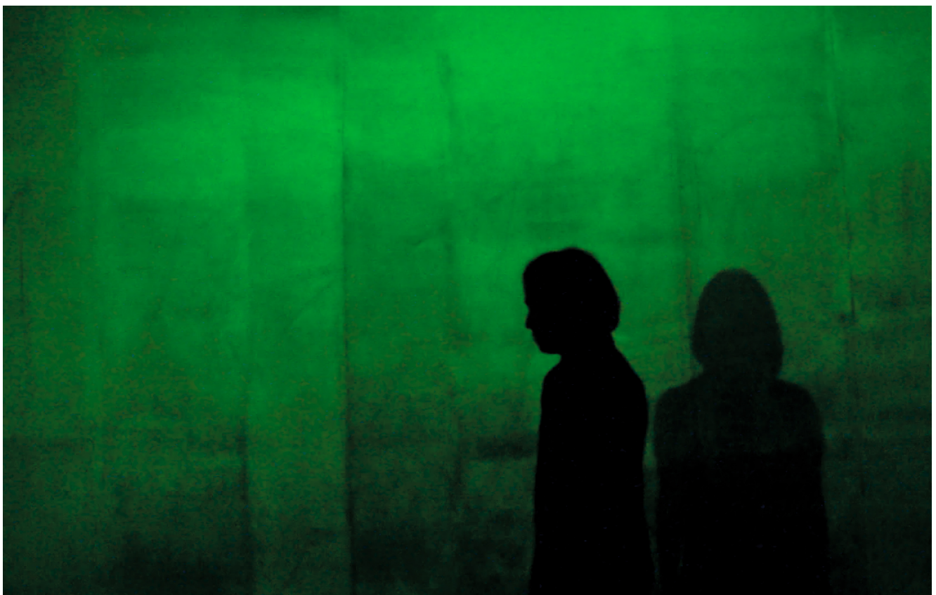
Ausschnitt Filmszene „The Cleaners“

Die Arbeit, die die großen Player aus dem Silicon Valley insbesondere nach Manila auslagern, eignet sich hervorragend dafür, zumal kaum mehr vonnöten ist außer einem Bildschirmarbeitsplatz samt Internetanbindung und fleißigem Personal, das die westlichen Werte- und Moralvorstellungen teilt. Beides bieten und liefern die Philippinen: eine gute digitale Infrastruktur in den Zentren des Inselstaates, eine Bevölkerung, die digital affin ist und deren Löwenanteil überdies einem innigen katholischen Glauben anhängt.