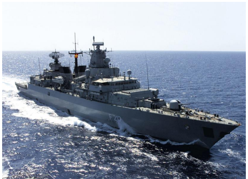
Die Fregatte Bayern während der Operation Enduring Freedom

Deutlich achtsamer verhalten sich Bundesregierung und Bundeswehr in Beziehung zu China. Das erzeugt zunehmend Irritationen bei Deutschlands Partnern in der Region. Pekings Verhalten gegenüber regionalen Anrainern steht nicht im Einklang mit dem Seerechtsübereinkommen. Peking erhebt strittige Territorialansprüche auf die von Japan verwalteten Senkaku-/Diaoyu-Inseln im Ostchinesischen Meer und darüber hinaus auf den Großteil des Südchinesischen Meeres – wobei das beanspruchte Gebiet auch die souveräne Republik Taiwan umfasst. Der Internationale Schiedshof in Den Haag hat am 12. Juli 2016 festgestellt , dass die Ansprüche Pekings nicht mit dem