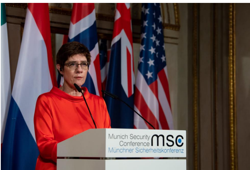
Verteidigungsministerin Annegret Kramp-Karrenbauer bei der Münchner Sicherheitskonferenz 2020

Im Mittelpunkt der indo-pazifischen Geografie – sowohl kartografisch wie auch ökonomisch – befinden sich am Übergang vom Pazifik zum Indischen Ozean das Südchinesische Meer sowie die Meerengen der Straße von Malakka, der Sundastraße und der Lombokstraße. Durch diese Meerengen wird jährlich nahezu ein Drittel des internationalen Warenhandels geschifft . Diese Warenströme sind nicht nur unabdingbare Voraussetzungen für eine funktionierende und florierende Weltwirtschaft, sie stellen gleichermaßen auch im Falle einer Störung oder Katastrophe auf See eine mögliche Bedrohung für die maritime Umwelt, die Sicherheit der Küsten und Hafenstädte sowie deren Bevölkerung dar. Darüber hinaus sind maritime Ressourcen – ob fossile Lagerstätten (Öl und Gas), Mineralien oder Fisch – sowie der Zugang zum Meer und seinen Ressourcen zunehmend umstritten.