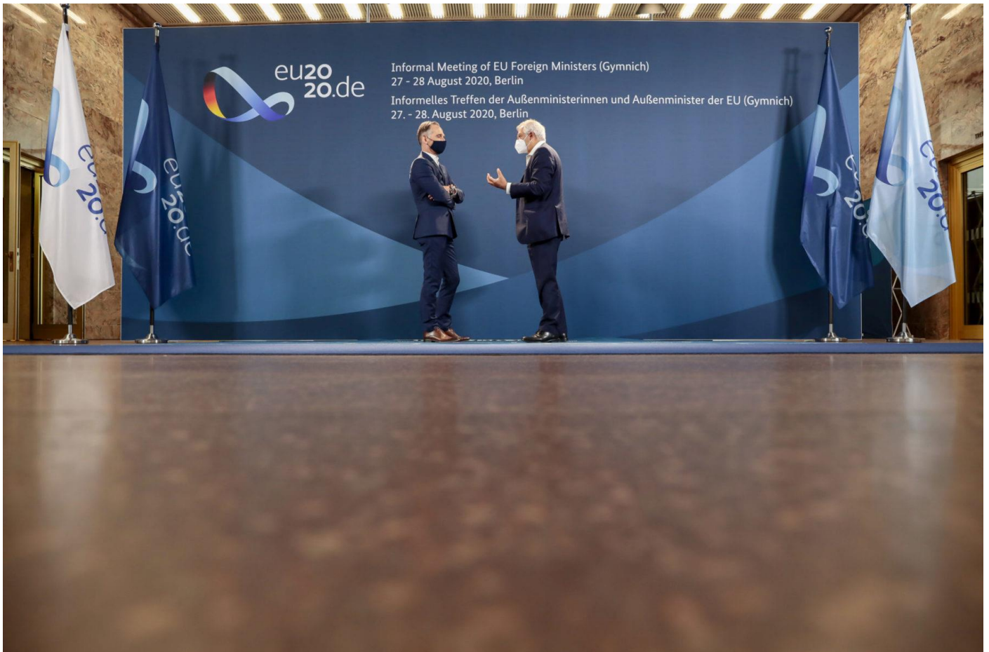
Bundesaußenminister Heiko Maas spricht mit Josep Borrell, Hoher Vertreter der EU für Außen- und Sicherheitspolitik, im August 2020 in Berlin

Südostasien und die Indo-Pazifik-Region rücken verstärkt in die Aufmerksamkeit deutscher Politik. Sicherheitspolitische und wirtschaftliche Erwägungen gehören dabei zu den Triebkräften.