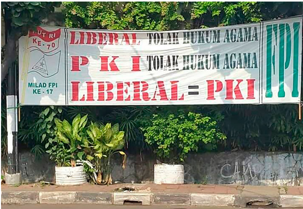
FPI Transparent: Liberalismus gleicht Kommunismus

als eine Furcht vor dem Atheismus am Leben zu halten.