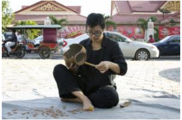
Die Wiederherstellung eines in Scherben liegenden Tontopfes ist ein aufwendiger Prozess, ebenso wie die Aufarbeitung eines Traumas.

Ich hoffe, dass meine Arbeit den Menschen eine Stimme gibt, die durch den Krieg vertrieben wurden, deren Familien unfreiwillig getrennt wurden oder die Familienmitglieder vermissen. All jenen, die Verlust und Sehnsucht erleben, und jenen, für die sich das Konzept des 'Abschlusses' abwesend anfühlt. Diese Hoffnung ist besonders stark für kambodschanische Staatsangehörige und solche, die in der Diaspora leben.