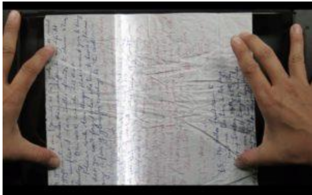
Ein Bild aus dem Video Scanning: Abgebildet sind die Hände des Künstlers, die einen Brief aus dem persönlichen Archiv scannen, ein handgeschriebenes Stück Korrespondenz zwischen den Eltern der Künstlerin vor der Machtübernahme der Roten Khmer. © Amy Lee Sanford

Als ich vor etwa zehn Jahren in Kambodscha lebte, kam mir die zeitgenössische Kunstszene jung, erfrischend und direkt vor. Mit "direkt" meine ich, dass das Experimentieren aufgrund der fehlenden Infrastruktur sehr zugänglich war. Spontane Kunstereignisse in kleinem Rahmen konnten unter dem Radar stattfinden und erhielten große Aufmerksamkeit (zum Beispiel durch Zeitungsberichte). In den USA gibt es schon seit langem eine zeitgenössische Kunstszene, und daher ist die Infrastruktur robuster und umfangreicher. Ein Nachteil ist, dass es in den USA auch viel mehr Prozesse, Bürokratie und Vorlaufzeit gibt, da die 'Maschinerie' der Szene viel komplexer ist.