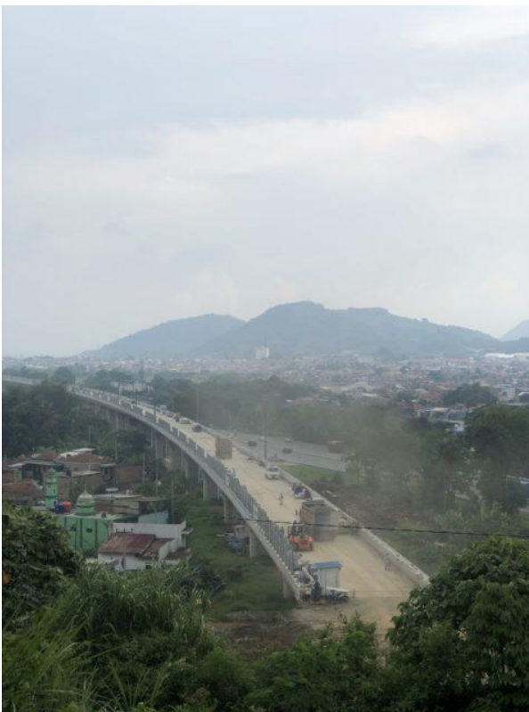
Beim Bau der Hochgeschwindigkeitsstrecke starben mehrere chinesische Arbeiter.

Durch die eingangs erwähnten Entwicklungs-Initiativen expandiert die chinesische Wirtschaft in andere Länder des Globalen Südens. Dabei wird das Verhältnis und Verständnis von Staat, Wirtschaft und Gesellschaft von der Volksrepublik China in die Länder mit transportiert. Es ergeben sich minimale partizipative Strukturen und oft eine vollständige Verweigerung, mit internationaler oder lokaler Zivilgesellschaft zu kommunizieren.