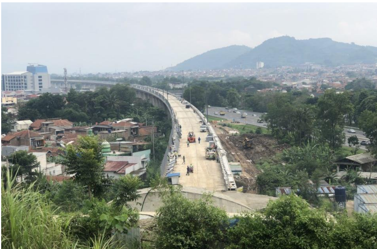
Bau der Hochgeschwindigkeitsbahn in Bandung

Indonesien/China: Das Potenzial chinesischer Entwicklungszusammenarbeit liegt in Finanzkraft, Infrastruktur-Erfahrung und Technologietransfer. Negative Auswirkungen dürfen jedoch nicht unterschätzt werden, wie das Beispiel der Jakarta-Bandung-Hochgeschwindigkeitsbahn zeigt.