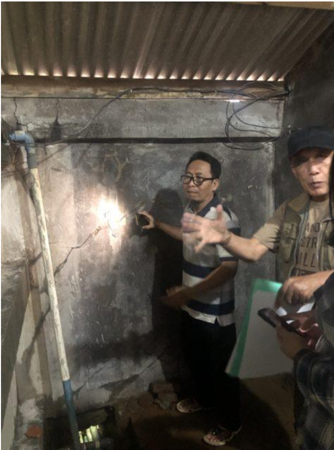
Auch der Zugang zu Wasser in den Gemeinden ist bedroht.

unterschiedlichen Kategorien. Die Volksrepublik selbst veröffentlicht nicht alle Informationen zu den Krediten, die sie vergibt, und ist nicht Teil des Pariser Clubs , des informellen Gremiums staatlicher Gläubiger.