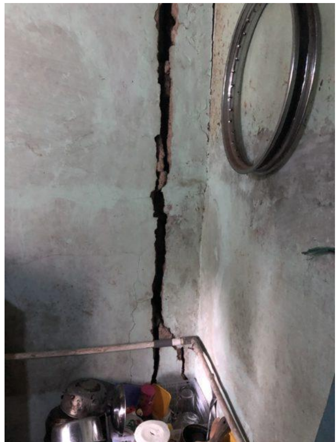
Risse verursacht durch die Sprengungen.

Chinas Entwicklungspolitik unterscheidet sich jedoch von anderen Geberländern. Die zweitgrößte Wirtschaftsmacht der Welt tritt als Schwellenland auf, das das eigene erfolgreiche Entwicklungsmodell in Form von Süd-Süd-Kooperationen weitergeben möchte. Ohne koloniale Vergangenheit und mit nachbarschaftlichen 'win-win' Zielsetzungen. Welches Entwicklungsmodell dies im Detail ist, bleibt unklar. Seit die Kommunistische Partei Chinas an die Macht kam, wurden verschiedene Entwicklungsmodelle erdacht und umgesetzt. Sie alle wurden jedoch auf die einzigartige Situation im eigenen Land zugeschnitten. Daher ist eine 1:1 Übertragung auf andere Länder des Globalen Südens aussichtslos.