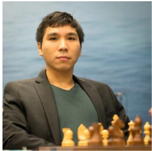
Schachgroßmeister Wesley So, der zum Schachverband der USA wechselte

Das ernüchternde Fazit lautet: Philippinische Spitzensportler*innen erhalten vom Staat keine angemessene Unterstützung. Der philippinische Sportsektor ist – auch im Vergleich zu Nachbarländern wie beispielsweise Thailand – stark unterfinanziert.