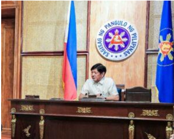
Präsident Ferdinand Marcos Jr. 2023

Für die Unterstützung und Förderung von Spitzensportler*innen und Trainer*innen sind in den Philippinen verschiedene Akteure zuständig. Die wichtigsten sind: