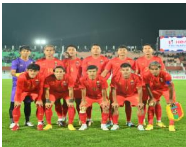
Die Nationalmannschaft Myanmars