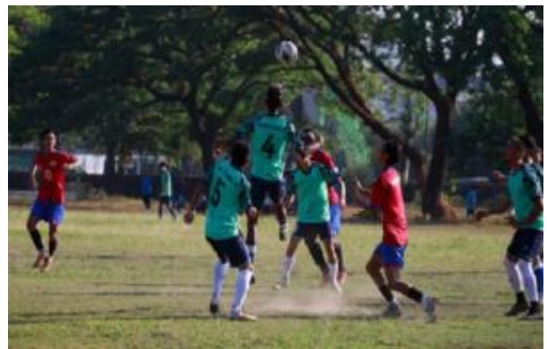
Gastspieler in einem Spiel der nationalen Liga

Trotz Boykott und Wirtschaftskrise lässt sich mit Fußball immer noch Geld verdienen, nicht nur mit den traditionellen Wett- und Glücksspielen. Junge Menschen unterstützen die Anti-Junta People's Defense Forces (PDF), indem sie das Interesse am Fußball ausnutzen. Die Revolution kann jetzt durch das Anschauen eines Spiels finanziert werden. Dafür werden auf Webseiten, die Fußballspiele übertragen, Werbegelder gesammelt.