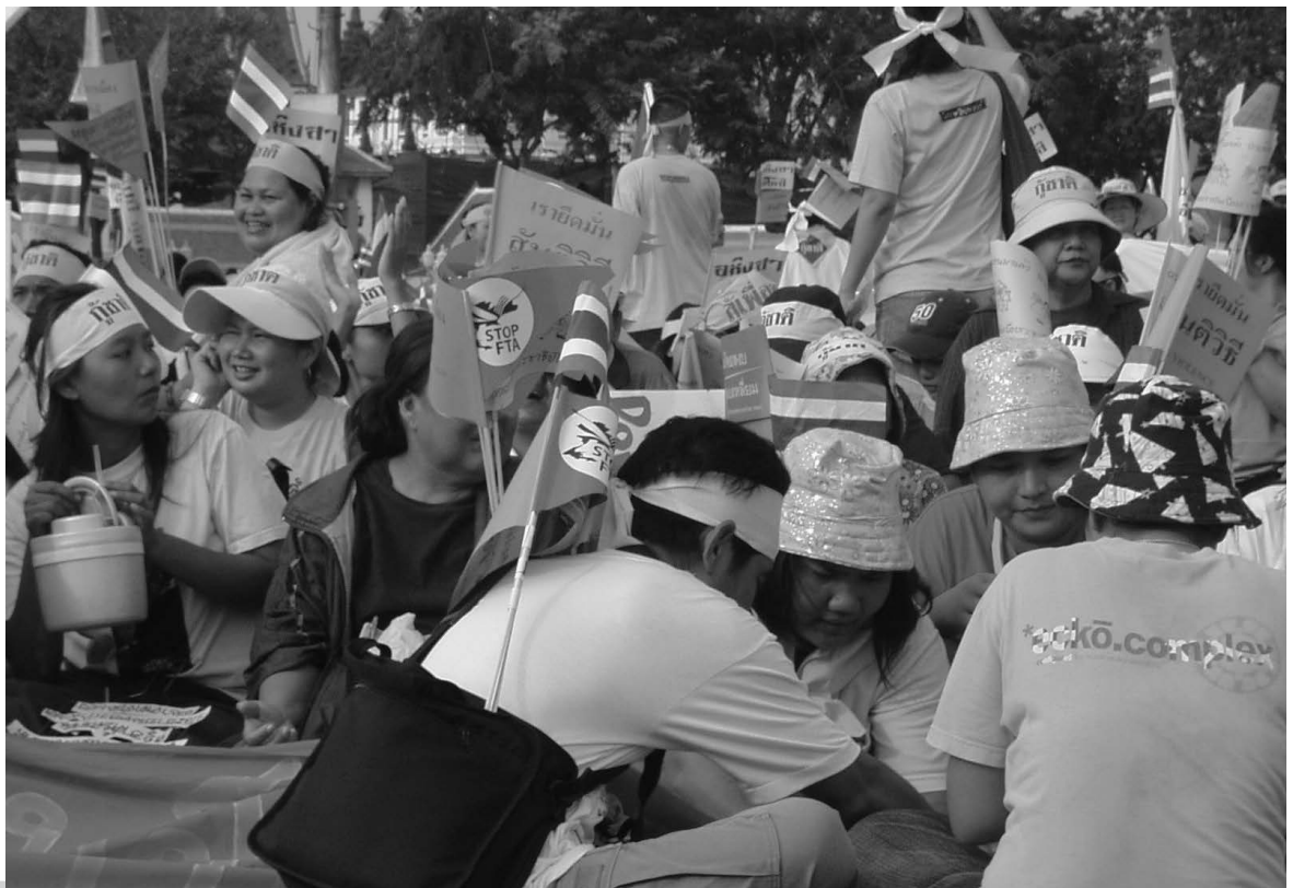
Fähnchen gegen das Thai-US-FTA waren in der Bewegung gegen Thaksin zunächst weit verbreitet

sen. Gleichzeitig lehnen gerade viele der organisierten Bauern, die auf Subsistenzwirtschaft und ökologische Landwirtschaft setzen, die Folgen einer verstärkten Exportorientierung ab, die sie mit Konzentrationsprozessen, Kommerzialisierung, Gentechnik und patentiertem Saatgut assoziieren. Letzteres erhitze schon 1997 die Gemüter, als eine US-amerikanische Firma eine gentechnisch veränderte Version von Jasmin-Reis unter dem Namen Jasmati patentieren ließ, was von Kritikern als Aneignung eines thailändischen Kulturgutes angeprangert wurde.