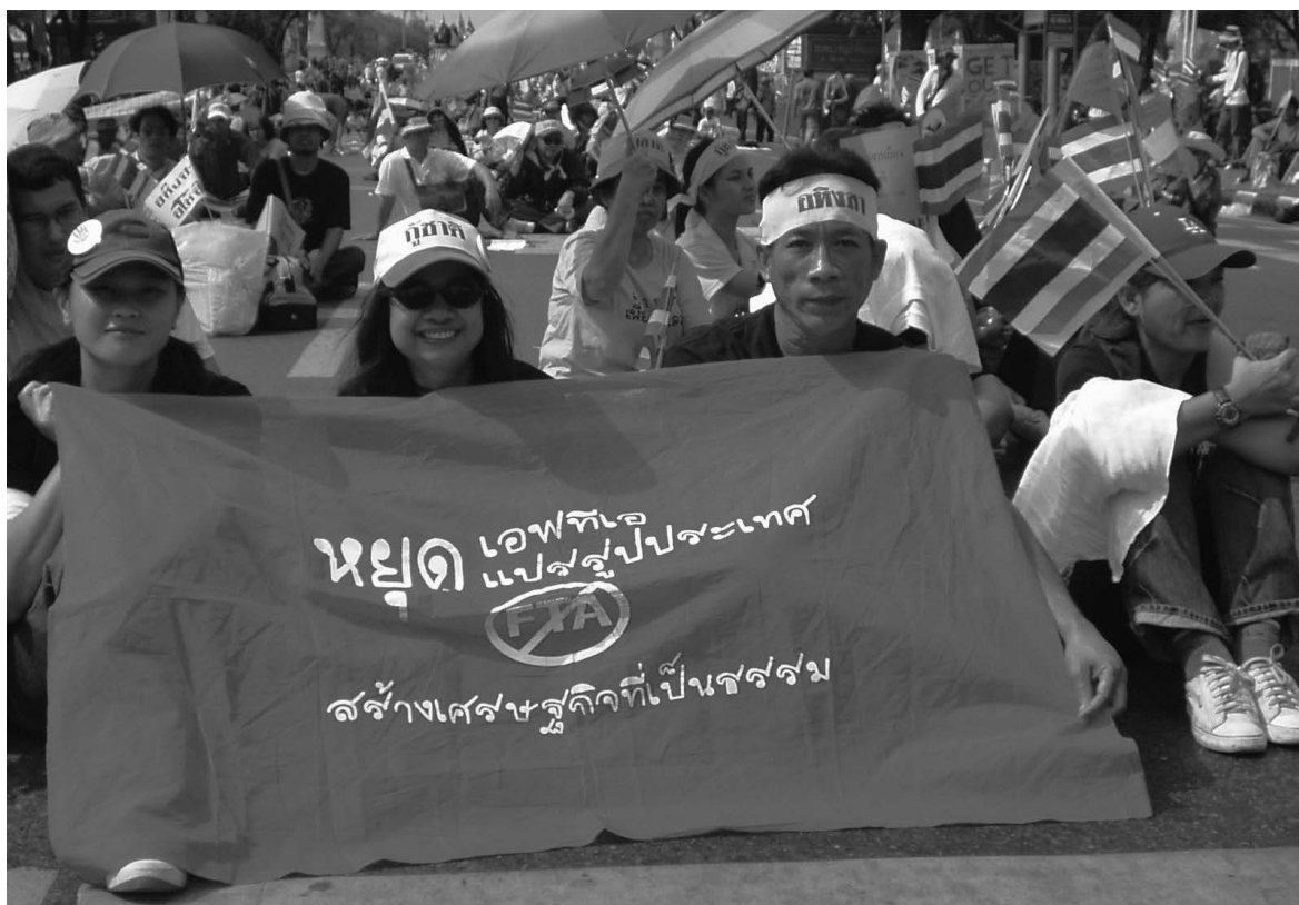
FTA Watch schloss sich der Bewegung gegen Thaksin 2006 an

In Thailand hat die Kritik an der neoliberalen Handelsagenda eine gewisse Massenbasis, vor allem bei den Kleinbauern und der auf sie orientierten Zivilgesellschaft sowie bei HIV-Positiven. Die Kleinbauern befürchten durch den Wegfall von Schutzzöllen die Konkurrenz der subventionierten Großbetriebe aus dem Norden. Reis, Mais oder Sojabohnen, auf Kleinstflächen produziert, wären auf Dauer den Dumpingpreisen der mechanisierten Massenproduktion aus den USA oder Europa nicht gewach-