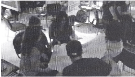
Teamarbeit auf dem Workshop.

Die Autorinnen sind Herausgeberinnen des Sammelbandes und geschäftsführender Vorstand der Südostasien Informationsstelle im Asienhaus, Köln.