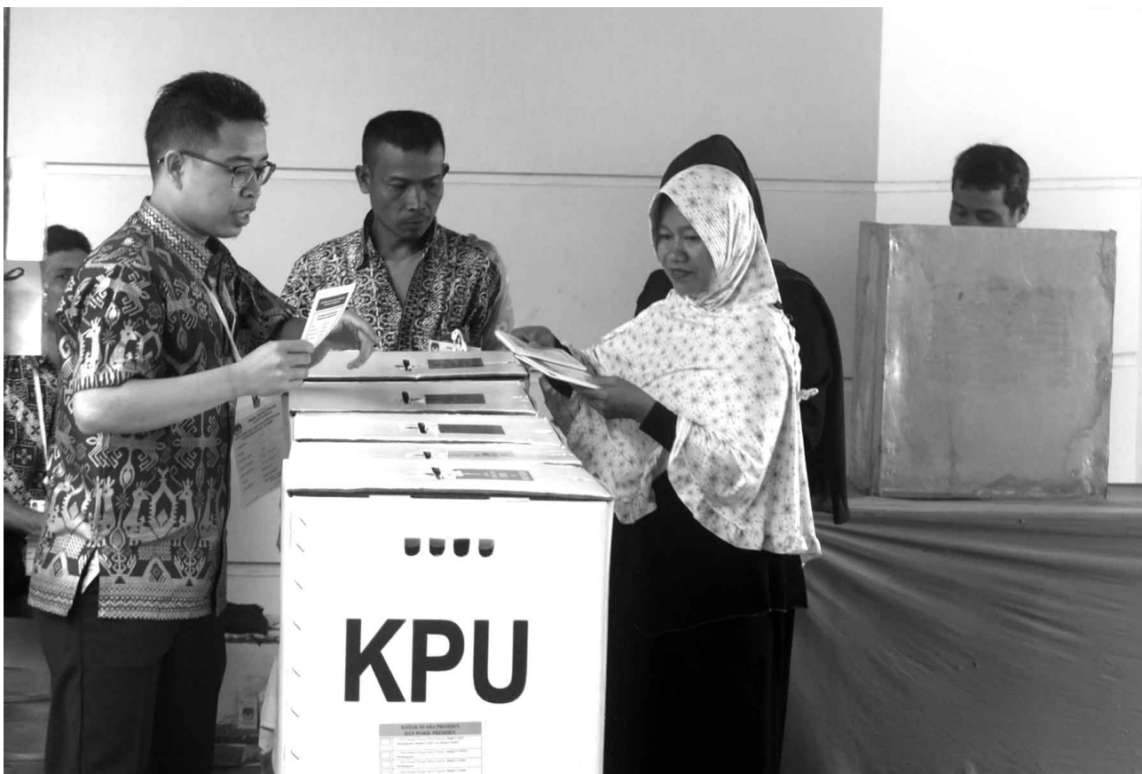
Indonesische Bürger*innen geben ihre Stimme im April 2019 in einem

Die Musik, die in Memobilisasi Kemukaan präsentiert wird, scheint den Vorschlag zu machen, golput zu betreiben, aber ihr Ziel ist noch weitergehend, insofern die Genoss*innen die Grundlagen der Wahlurnenpolitik Indonesiens hinterfragen. Betrachtet man den Inhalt des Albums, sowohl was die Bands, die Texte als auch das beigelegte Heft, ist eine Tendenz in Richtung golhit deutlich spürbar. Neben den beteiligten Akteur*innen ist ein weiterer Grund, dass die Produktionsweise und die Verteilung auf ethische Weise selbst als DIY vorgenommen wurden und sich eines anarchistisches Untergrund-Kollektiv-Schemas bedienen als eine Abwandlung der Black Bloc -Produkte den Weg der sozialen Bewegung [der Schwarze Block , auf Indonesisch auch bloc hitam , ist eine Taktik von Protestierenden, d. Red.]