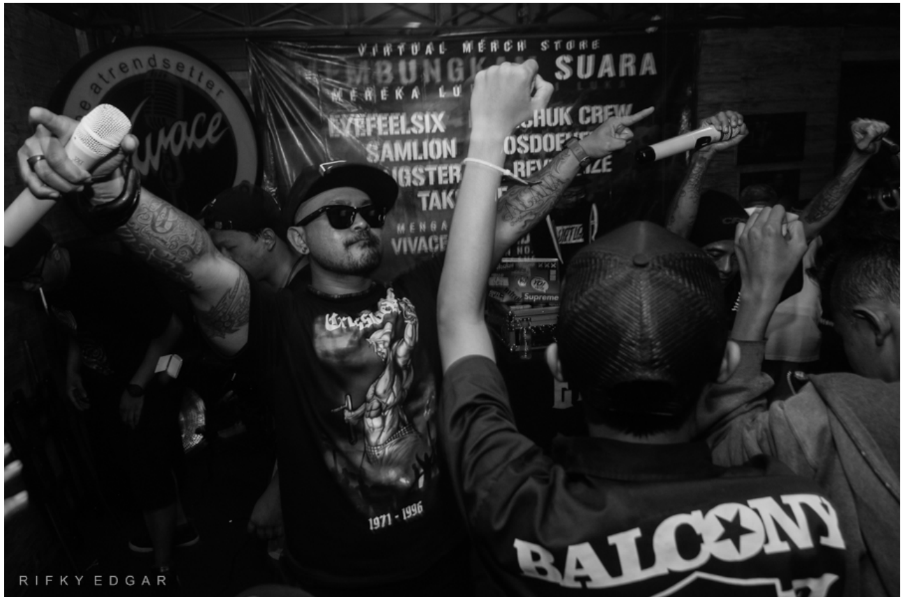
Die Band Eyefeelsix bei einem Auftritt