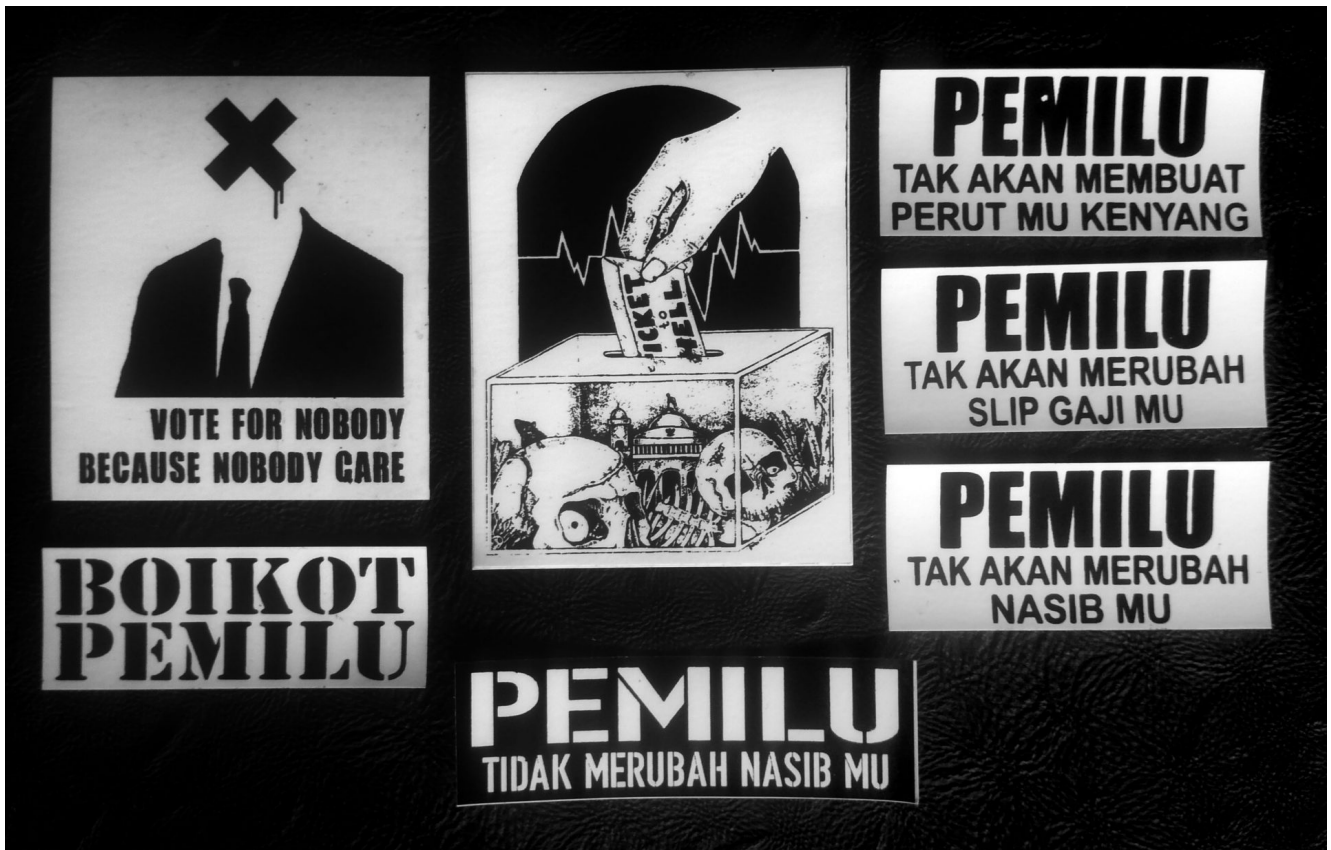
Proteststicker gegen die Wahlen 2019, fotografiert in Bandung

Mit der Entwicklung seit der reformasi entstand viel Diskussion über repräsentative Demokratie. Allgemeine Wahlen ( pemilu ) und politische Parteien werden als Möglichkeiten angesehen, Bürger*innenrechte zum Ausdruck zu bringen. Doch ihre Macht ist mithin auf eine ‚Demokratie der Wahlurnen‘ beschränkt und manifestiert sich mittlerweile in einer Krise der Demokratie. Sie steht unter dem Druck von Populismus, Nationalismus, Identitätspolitik und sogar Faschismus. Was zurzeit in Indonesien im Argen liegt, zeigte sich bei den Wahlen 2014 und 2019, die Joko Widodo (genannt ‚Jokowi‘) gewann.