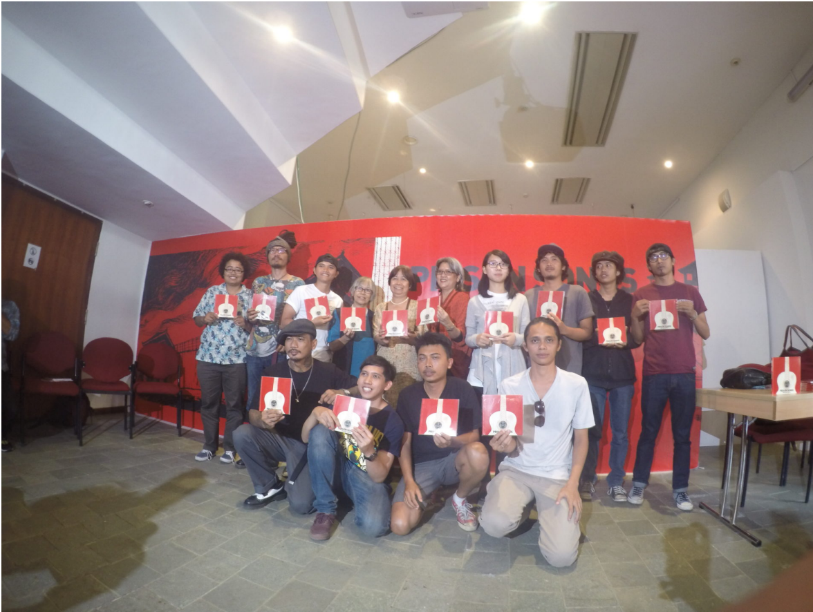
Launch des Albums Prison Songs 2015 in Jakarta