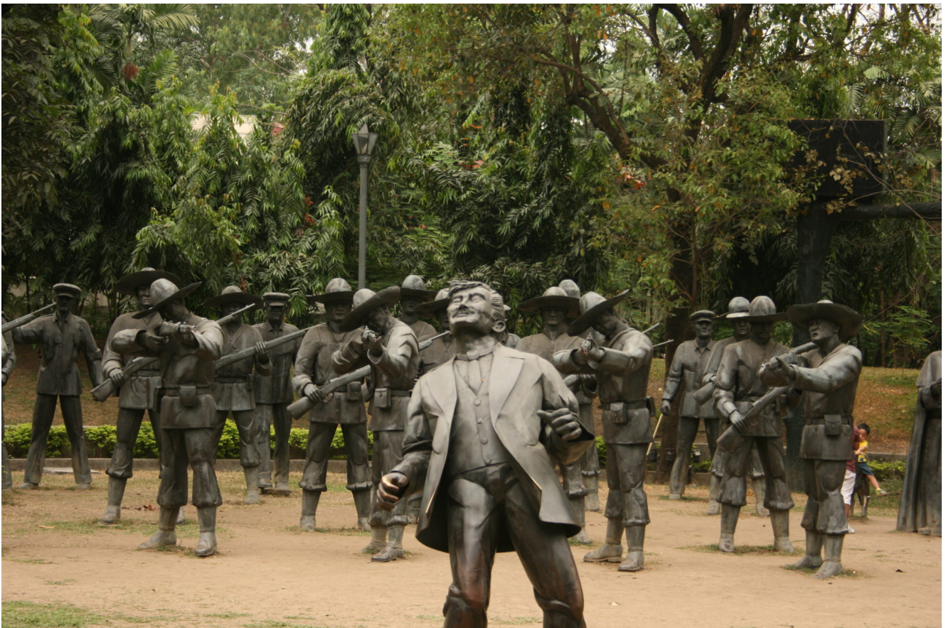
Bild1: Im Rizal Park in Manila steht ein Denkmal für José Rizal. Es ist der Ort, an dem er erschossen wurde.

Drache flog hoch, der alte Taube träumte vor sich hin). Der „alte Taube“ spielt auf Ferdinand Marcos an, der in seiner jahrzehntelangen Regentschaft das Volk unterdrückte und das Land in den wirtschaftlichen Ruin führte. Dies wird dem Wirken Rizals gegenüber gestellt, der für die Befreiung der Filipin@s von der kolonialen Fremdbestimmung durch Spanien kämpfte und die Identität der Menschen prägte.