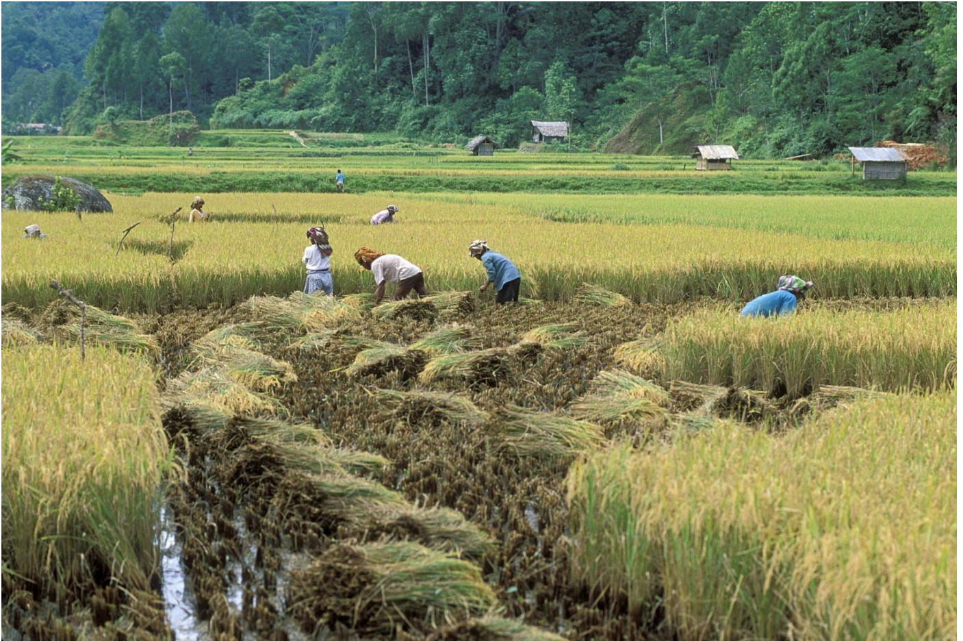
Reisernte in Indonesien © Curt Carnemark / World Bank lizenziert unter CC BY-NC-ND 2.0

Indonesien: Ist Ernährungssicherheit ohne den Sicherheitsapparat möglich? Die wachsende Rolle des Militärs im Agrarsektor und der damit einhergehende Einfluss bis auf Dorfebene geben Anlass zu fragen, wer wirklich von den Maßnahmen der Regierung zur Bewältigung der Nahrungsmittelkrise profitiert.