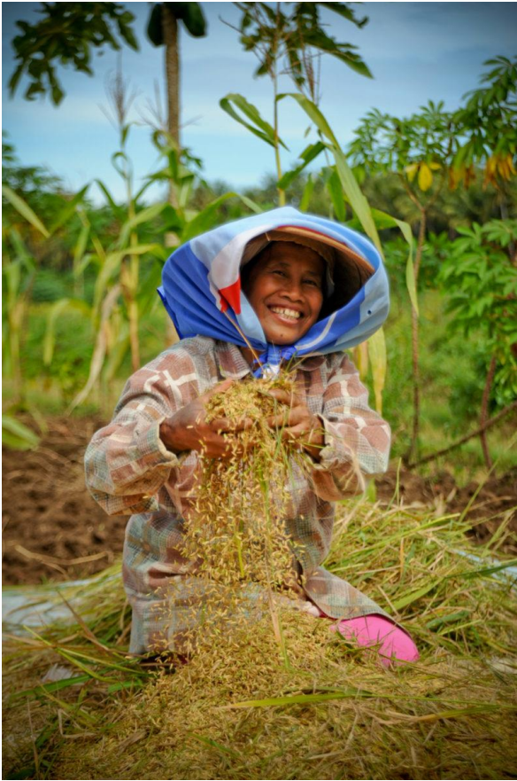
Ein Bäuerin aus dem Dorf Bojong in der Nähe von Yogyakarta, säubert frisch gedroschenen Reis

Diese Kontrollen ermöglichen es den niederrangigen Militärangehörigen, von den Dorfbewohner*innen, die im Zentrum der lokalen Versorgungsketten stehen, Geld zu kassieren, um Lagerbestandslisten zu genehmigen, Anfragen der Regierung nach Infrastruktur- und Maschinenunterstützung zu bewilligen, ihnen Schutz zu bieten und natürlich um Verstöße gegen die Vorschriften nicht zu melden. Die erweiterte Rolle der Armee im Agrarsektor hat auch dazu geführt, dass niederrangige Militärs auf Dorfebene (Babinsa) Daten anfordern und landwirtschaftliche Beratung anbieten anstelle von Beratern aus den lokalen Landwirtschaftsbehörden, die seit 2009 immer mehr ausgegrenzt werden.