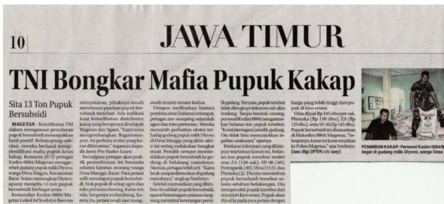
Die Schlagzeile lautet: „Das Militär entlarvt den Dünger einer großen Mafia“. Quelle: Jawa Pos, 7. März 2015.

Dieser Text erscheint unter einer Creative Commons Namensnennung 4.0 International Lizenz