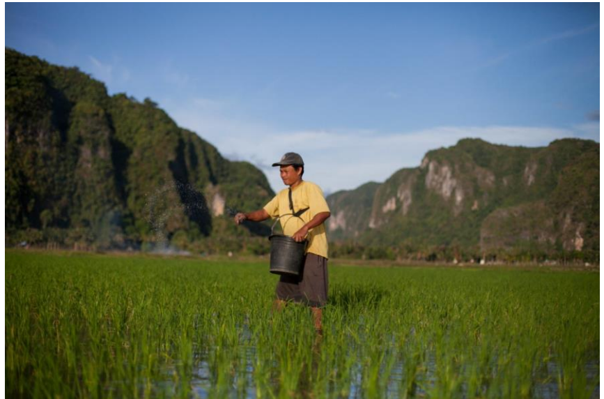
Bauer beim Düngen eines Feldes in Pangkep, Südsulawesi, Indonesien

Indonesiens Agro-Nationalismus hat in den vergangenen zehn Jahren an Bedeutung gewonnen. Im Mittelpunkt der agro-nationalistischen Agenda der Regierung steht das Ziel, die Produktion einheimischer Nahrungsmittel zur nationalen Selbstversorgung zu erreichen. Dies hat dazu geführt, dass die Regierung Land für die landwirtschaftliche Produktion bewahrt und erschlossen, eine Anti-Lebensmittelimport-Agenda gefördert, die Zentralisierung des Agrarsektors reguliert und die agrarische Identität Indonesiens in Politik und Propaganda betont hat. Zur Unterstützung dieser Maßnahmen hat die Regierung den Agrarsektor mit immer höheren Subventionen unterstützt.