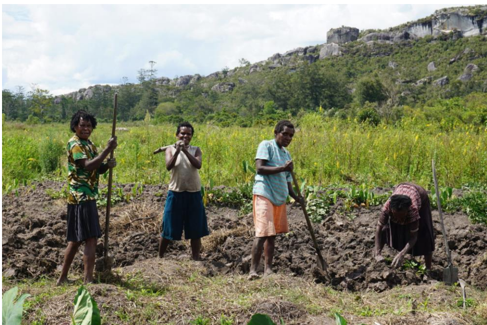
Frauen bei der Gartenarbeit auf fruchtbaren Feldern im Baliem-Tal, Umgebung von Wamena, 2018

Die Mehrzahl der indigenen Bevölkerung lebt von Subsistenzwirtschaft in ländlichen Gebieten. Es ist Aufgabe der Frauen, die Gärten zu bepflanzen und zu ernten. Sie sorgen so für den Lebensunterhalt ihrer Familien und verkaufen lediglich ihre Überschüsse auf lokalen Märkten, um Geld für Extrakosten (Schule, Kleidung, Transport) zu verdienen. Die Marktstände, wo sie Obst und Gemüse anbieten, sind häufig am Straßenrand. Ihre Einkünfte sind äußerst gering (bis zu einem halben Euro/Tag).