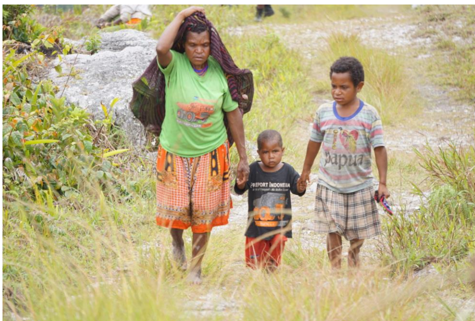
Frau mit ihren Kindern im Dani Gebiet südlich von Wamena, 2018

Frauen und Mädchen erleben auch viel Gewalt in ihren Beziehungen und Familien. Die häusliche Gewalt ist ebenso erschreckend wie die staatliche Gewalt im Zusammenhang mit Widerstand und Diskriminierung. In Jayapura, der Hauptstadt der Provinz Papua, gaben in einer Umfrage 60 Prozent der befragten Männer an, in ihrem Leben emotionale, physische oder sexuelle Gewalt gegen ihre Partnerin angewendet zu haben ( Partners 4 Prevention / UN-Agencies, Factsheet Papua Indonesia, 2017 ). Su, eine der betroffenen Frauen, berichtet: „Mein Ehemann kommt oft nicht nach Hause. Ich werde oft von ihm geschlagen und bekomme kein Geld für den Haushalt und um nach den Kindern zu schauen“ ( Enough Is Enough! 2009-2010:41).