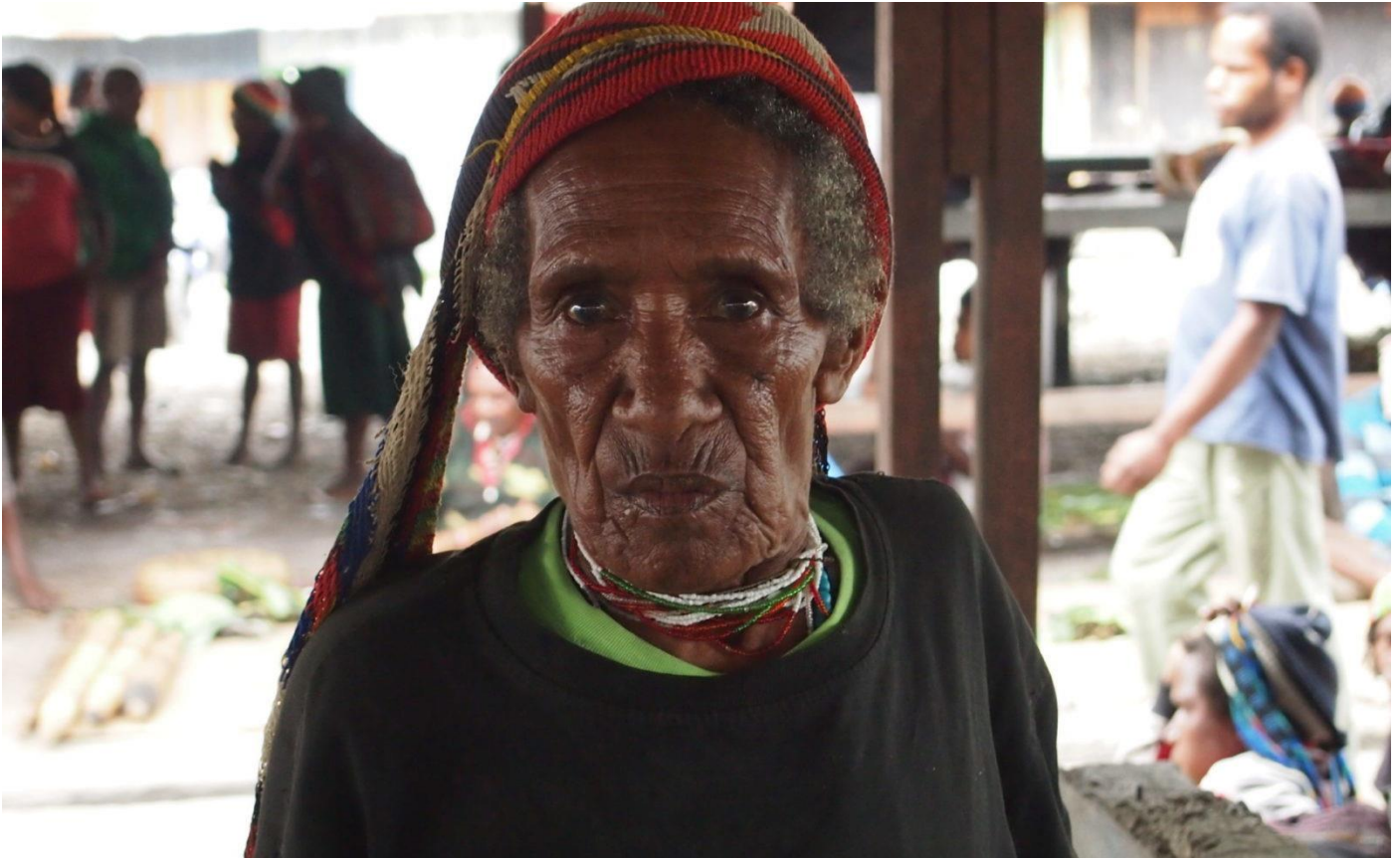
Alte Frau auf dem Markt in Wamena, Papua-Hochland, 2013

In Indonesiens östlichsten Provinzen Papua und West Papua sind Frauen massiver Gewalt durch Militärs und Polizisten ausgesetzt. Außerdem ist häusliche Gewalt äußerst weit verbreitet.