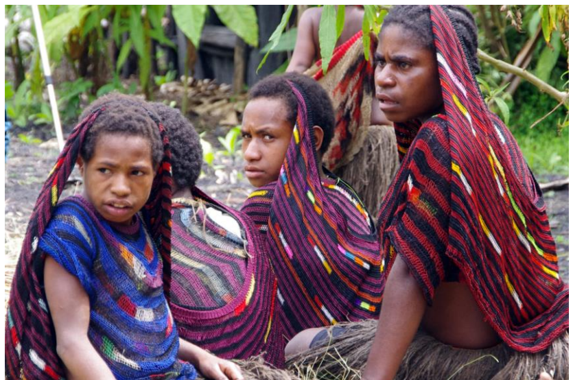
Mädchen während eines Schweinefestes in Soroba im Baliem-Tal, 2012

Die Republik Indonesien garantiert laut Verfassung von 1945 die soziale, politische und ökonomische Gleichstellung zwischen den Geschlechtern. Daneben sichert seit 2001 auch die Sonderautonomie für Papua und West Papua die Gleichberechtigung der Geschlechter. Nach Artikel 47 des Autonomiegesetzes ist die Regierung gehalten, die Rechte von Frauen zu fördern und zu schützen und alles zu unternehmen, um sie Männern gleichzustellen.