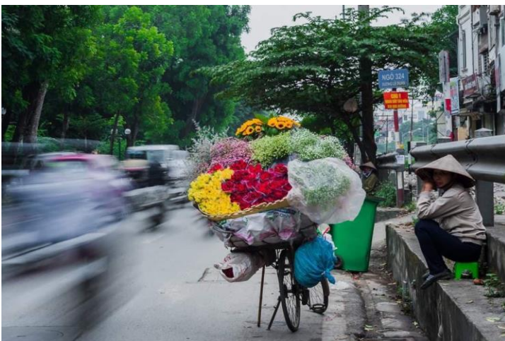
Die feministische Bewegung in Vietnam steckt noch in den Kinderschuhen. Unsere Autor*innen glauben an einen langsamen, aber stetigen Wandel.

Von Frauen wird implizit erwartet, dass sie vor der Ehe unschuldig, rein und ‚intakt‘ sind. Auch wenn Sex vor der Ehe kein Tabu mehr ist, werden Frauen, die vor der Ehe Sex haben, als ‚befleckt‘ angesehen. Sowohl sexueller Missbrauch als auch Sex vor der Ehe sind mit Scham verbunden. Wenn vietnamesische Mädchen einen Freund haben, bevor sie verheiratet sind, ist das für sie mit der Sorge verbunden, dass er sie verlässt und sie keinen neuen Partner finden.