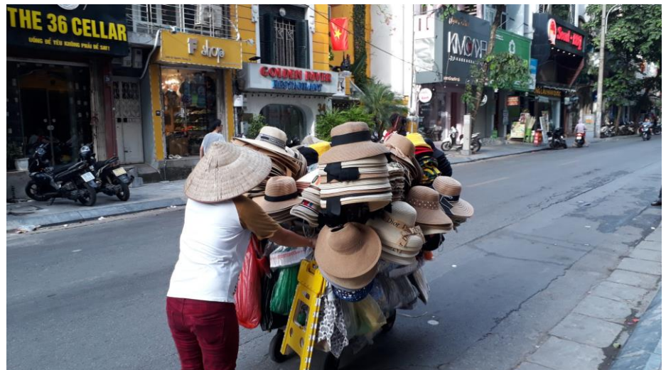
Für eine Frau soll die Familie über allem stehen, erklären unsere Autorinnen die Sicht der vietnamesischen Gesellschaft

Die Ungleichheit zwischen den Geschlechtern ist in den nördlichen Provinzen stärker ausgeprägt als im Süden. Nordvietnam – mit der Grenze zu China – ist stark von konfuzianischen Werten beeinflusst. Der Konfuzianismus wurde im 10. Jahrhundert als offizielle Ideologie des feudalistischen Staates Vietnam übernommen. Das hat Spuren hinterlassen, die bis in die Gegenwart reichen. Der Neokonfuzianismus, der unter der Song-Dynastie blühte und sich bis nach Vietnam