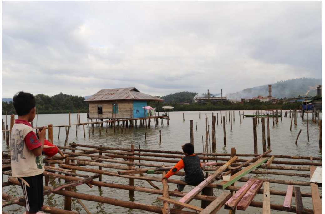
Verschmutzung durch ein Kohlekraftwerk und eine Nickelschmelze im Besitz eines chinesischen Unternehmens in Zentralsulawesi

kontrolliert, die enge Verbindungen zur Suharto-Familie hatten. Laut Zahlen des Ministeriums für Umwelt und Forstwirtschaft umfassten im Jahr 2018 die Konzessionsflächen für Unternehmen in der Provinz Ostkalimantan 5,6 Millionen Hektar (44,09 Prozent der Gesamtfläche). Das bedeutet, dass Durian- Gärten und -Wälder zerstört und abgeholzt werden, um Platz für Palmölplantagen oder Bergbau zu machen. Die Holzsorten Meranti und Bangkirai stehen bei Holzhändlern hoch im Kurs. Werden sie gefällt, fallen die Durian-Bäume mit.