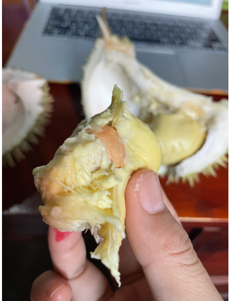
Das Fruchtfleisch einer Durian.