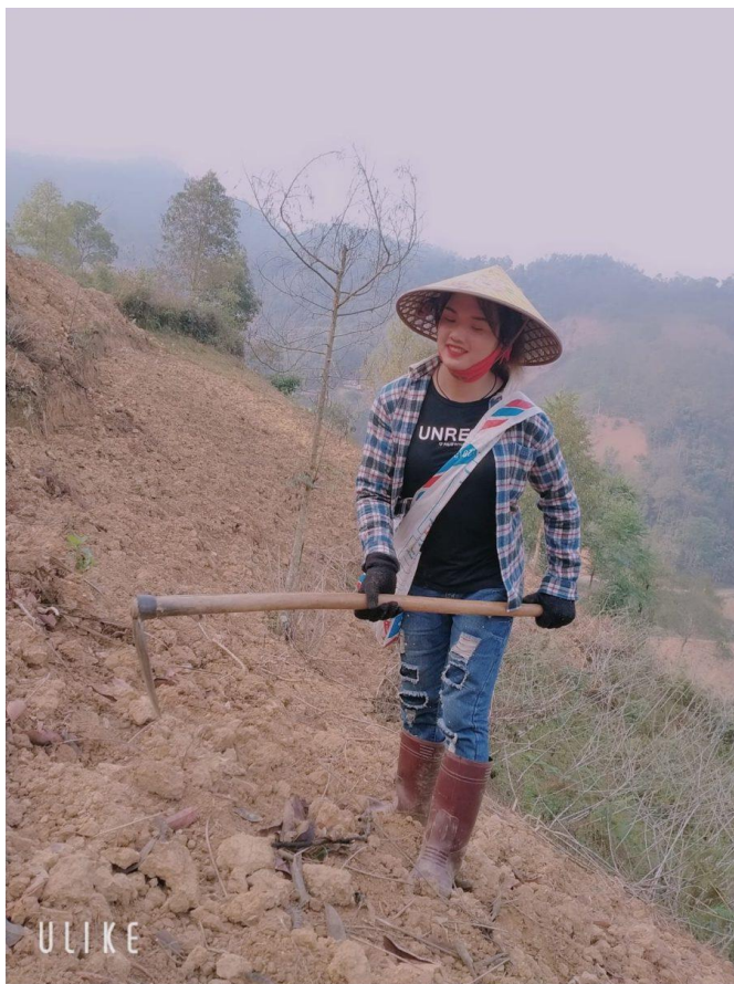
„Wie ein Fisch außerhalb des Wassers“ – Transsexuelle Jugendliche auf dem Land haben kaum Möglichkeit zum Kontakt mit Menschen, die eine ähnliche Identität haben.

„Die Richtlinien werden von den lokalen Behörden umgesetzt, die meistens alles andere als gendersensibel sind“, sagt eine andere Aktivist*in aus Hanoi, die anonym bleiben möchte. „Viele von ihnen sind ratlos, wie sie mit einem Antrag auf eine ID-Änderung umgehen sollen. Sie haben Angst, Fehler zu machen und verzögern deshalb oft die Bearbeitung dieser Fälle.“