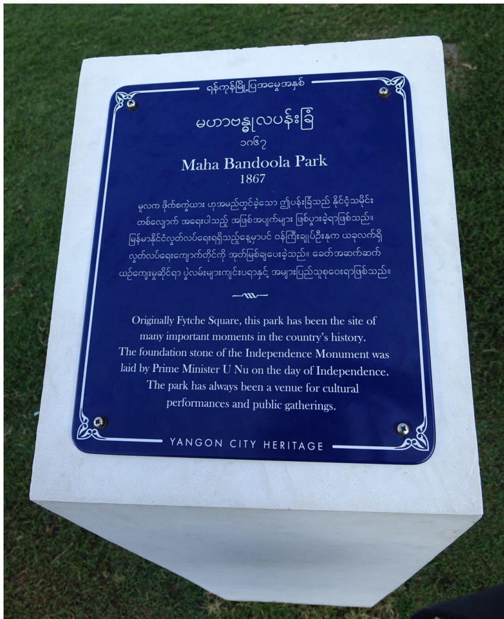
Blaue Plakette im Mahabandoola-Park

Doch die monumentalen Gebäude waren für die Stadtbevölkerung – abgesehen von der Bildungselite, die als Verwaltungskräfte und Politiker*innen dort ein- und ausgingen – keine wertvollen Erinnerungsorte. Die Bemühungen, mit der Unabhängigkeit 1948 eine neue nationale Identität zu gestalten, waren primär antikolonial und bezogen sich auf die Zeit der buddhistischen Königtümer. Über Jahrzehnte pflegte niemand die Wertschätzung kolonialer Architektur. Im Gegenteil: die urbane Bevölkerung wurde noch mehr von den Prachtbauten entfremdet, da diese (wenn auch widerwillig) von der ungeliebten Militärregierung genutzt wurden.