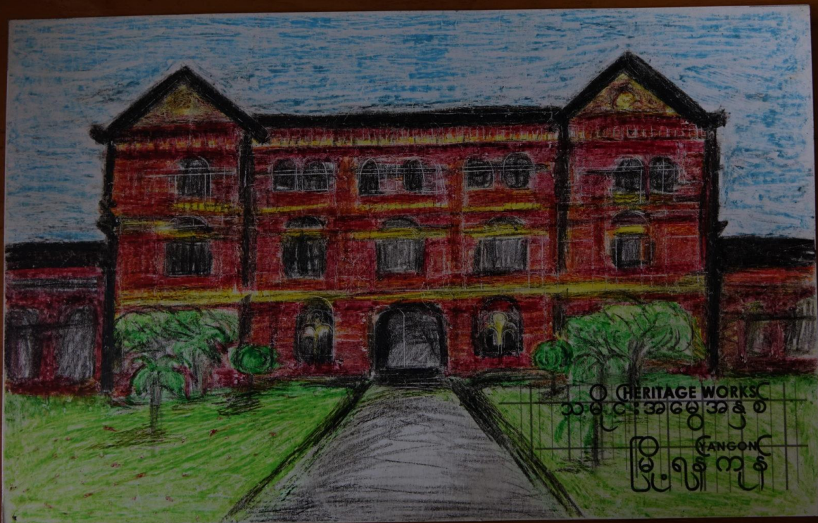
Bild des ‚Secretariat‘ in Yangon, erstellt im Rahmen von Heritage Works! (2015)

Myanmar: Yangons koloniale Architektur ist weltberühmt. Seit 2013 versuchen Organisationen, die lokale Bevölkerung für dieses zwiespältige Erbe zu sensibilisieren. Dafür braucht es jedoch mehr als einen elitären Diskurs.