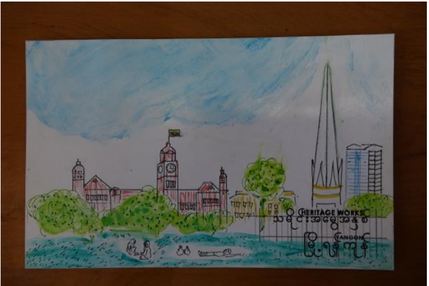
Gemaltes Bild des Hohen Gerichtshofs (High Court), mit Unabhängigkeitssäule © Felix Girke

Diese Sätze sind kein Zeugnis eines ‚authentischen‘ Empfindens. Wenn man die Postkartenaktion als Erinnerungsprojekt versteht, ist vor allem deren Entstehungsprozess bedeutsam: Was bedeutet es für das größere Anliegen, die Wertschätzung der Kolonialbauten zu erhöhen, wenn vor Yangons Rathaus Hunderte von bunten Postkarten im Wind baumeln, die vorgeblich demonstrieren, wie sehr bereits Kinder das Stadtbild und einzelne Gebäude schätzen? Meines Erachtens stellt die Postkartenaktion einen spannenden Versuch da, etwas zu demonstrieren, was man eigentlich erst erzeugen will – dass Kinder ihre Stadt und deren historische Gebäude schätzen. Es kann kaum eine bessere Rechtfertigung für eine umfassende stadtplanerische Neuausrichtung im Namen von heritage geben. Aber die Postkarten zeigten mitnichten die Lieblingssorte der Kinder – vielmehr demonstrierten sie den Mangel an Vertrautheit der Schüler*innen damit, auf diese Weise über eine Stadt (oder Streetscape ) nachzudenken, oder öffentliche Gebäude als etwas zu verstehen, das man mögen kann.