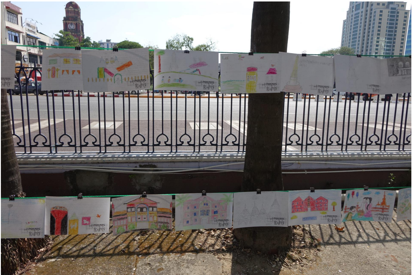
Installation der Postkarten vor dem Rathaus, mit High Court im Hintergrund (links)