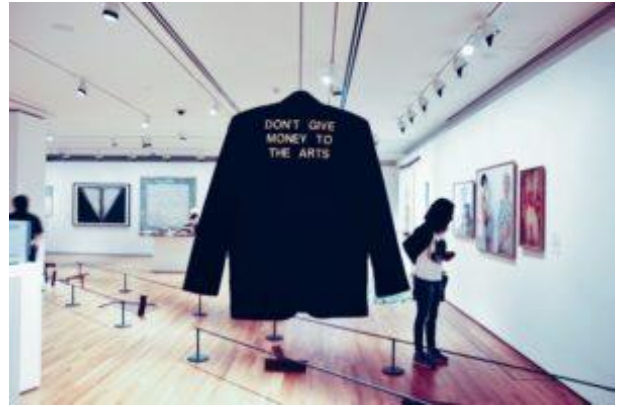
"Gib kein Geld für die Kunst" steht auf dieser in der National Gallery of Singapore ausgestellten Jacke. Die Unesco-Studie empfiehlt genau das Gegenteil. Die Staaten Südostasiens sollten Kunstschaffende stärker finanziell fördern und damit nachhaltige Entwicklung unterstützen.

Die Ergebnisse der Studie sind nicht repräsentativ und auch nicht vollständig – das können sie naturgemäß auch nicht sein. Aber sie sind aussagekräftig bezüglich des breiten Spektrums von Akteur*innen der sogenannten Cultural Creative Industry (CCI). Diese umfasst Künstler*innen-Kollektive und Genossenschaften, gemeinnützige Vereine und kulturell ambitionierte NGOs ebenso wie Privatunternehmen und Stiftungen. Diese kulturellen Ressourcen bieten ein großes Potential für nachhaltige Entwicklung in Südostasien, so ein Fazit der Autor*innen. Dennoch können sich bisher nur wenige Kulturinitiativen finanziell selbst tragen und den Lebensunterhalt der Akteur*innen sichern.