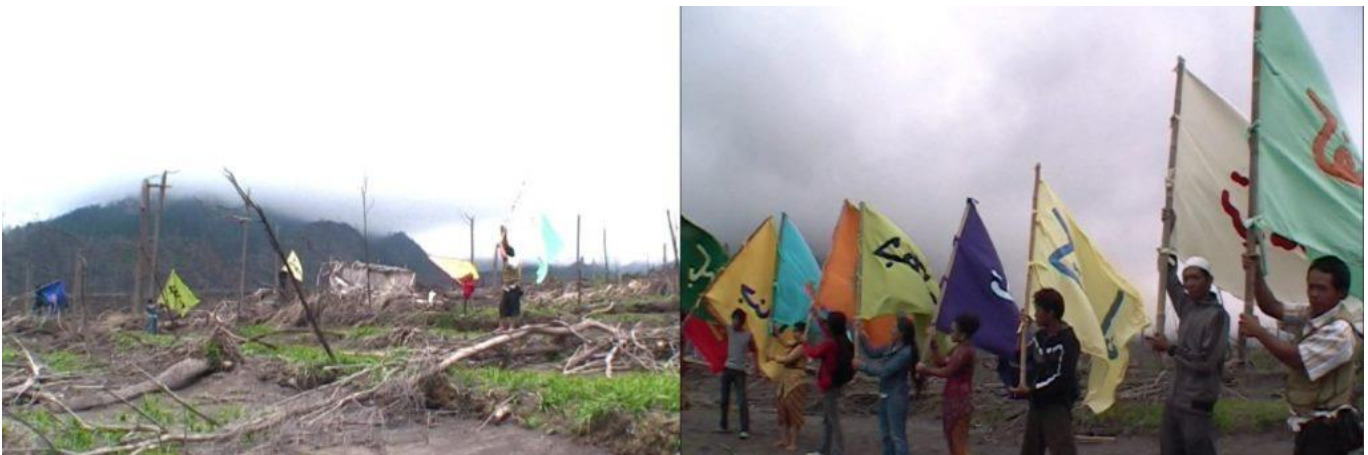
Standbilder aus der Dokumentation des Proyek Bendera (Flaggenprojekt) Performance mit dem Titel Crossing Point , 2011, mit Aktivisten und Gemeinschaften am Vulkan Merapi (nach dessen verheerendem Ausbruch 2010), Yogyakarta, Indonesien, https://www.youtube.com/watch?v=87qvoOIkPDY&t=13s

Arahmaianis Arbeiten ab 2006 versuchen, die Erfahrungen und die Realität von Muslim*innen zu zeigen, die aktiv zur Gestaltung der Wahrnehmung des globalen Islam beitragen. Laut Arahmaiani öffnet ihre kollaborative Methode ihre künstlerische Praxis und macht sie dadurch "partizipativ und aktiv und bezieht somit jeden, der sie sieht und sich ihr anschließt, in die Schaffung einer Grundlage für eine offenere, demokratischere, gleichberechtigte und tolerantere Gesellschaft mit ein".