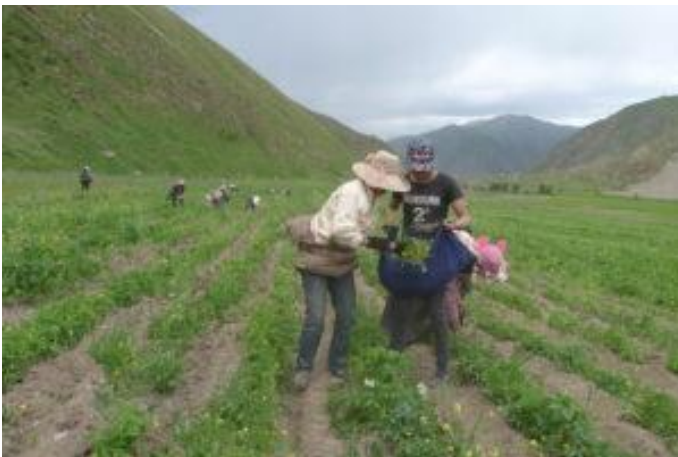
Gemeinschaftsfarm im Dorf Lab, Tibet, 2014. © Arahmaiani (alle Rechte vorbehalten)

Berücksichtigung der Bedeutung des tibetischen Plateaus als Wasserquelle für die großen Flüsse Asiens, entwickelte Arahmaiani mehrere Umweltprogramme: Abfallmanagement, Wiederaufforstung, Flusswassermanagement für den täglichen Gebrauch und als Energiequelle, biologische Landwirtschaft, Wiederbelebung des Nomadentums, Erzeugung von Energie aus Wasserkraft und Installation von Solaranlagen. In den ersten fünf Jahren erhielt das Programm die Unterstützung des obersten Mönchs und der Dorfbewohner*innen aus sechzehn verschiedenen Dörfern. 2015 wurde die Zusammenarbeit offiziell von der chinesischen Regierung unterstützt, da viele der Programme in die Umweltpolitik der Regierung passten.