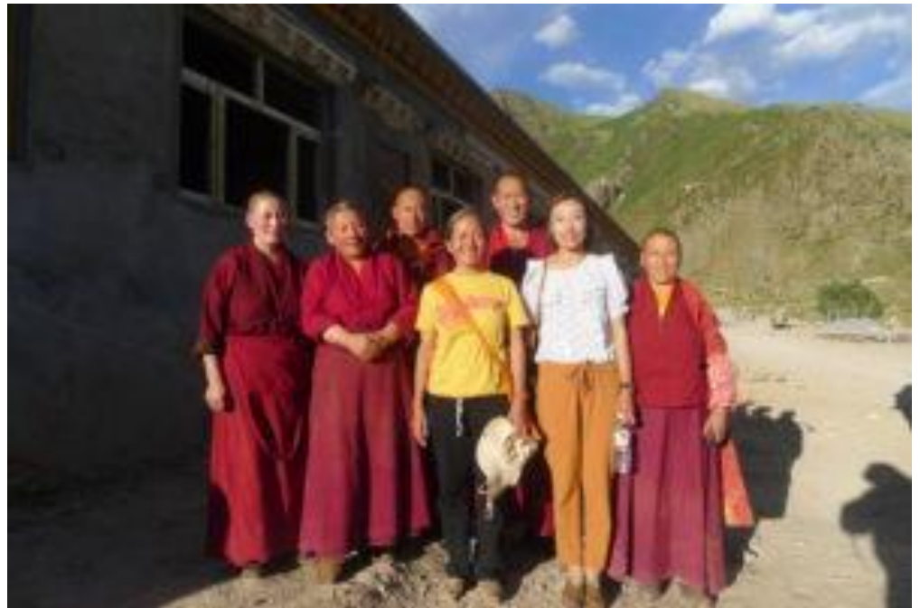
Arahmaiani mit Nonnen und Mönchen im Lab-Kloster, Tibet, 2015. © Arahmaiani (alle Rechte vorbehalten)

Arahmaianis Interesse an Umweltfragen in ihren aktivistisch ausgerichteten und gemeinschaftsbasierten Projekten ist eine Erweiterung ihres Engagements als Muslimin für transkulturelle und interreligiöse Dialoge, die (wieder)herstellende Lesarten gegenüber dem Islam und den Muslim*innen hervorbringen und die durch die Modernisierung auferlegte Gewalt wiedergutmachen könnten. Basierend auf Ökofeminismus und reparativem Feminismus