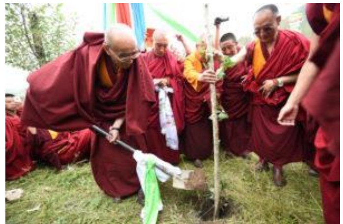
Baumpflanzungsritual durch einen Lama im Dorf Lab, Tibet, 2014.