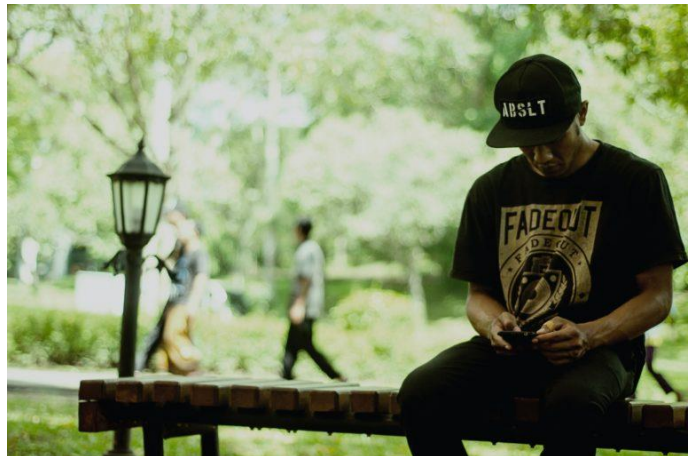
Indonesien hatte als einziges G-20-Mitglied kein Gesetz zum Schutz privater Daten, bis im September 2022 das PDP-Gesetz verabschiedet wurde.

Die vierte Herausforderung ist die Koordination zwischen den Sektoren. Das PDP-Gesetz wird voraussichtlich die Dachverordnung sein, die alle PDP-Themen regelt. Daher ist zu hoffen, dass eine unabhängige und einzige PDP-Behörde sich mit verschiedenen Ministerien/Behörden koordinieren kann, die sektoral Regularien herausgeben. Diese Koordination und Ausrichtung ist eine große und langfristige Aufgabe, um sinnvolle Schutzmaßnahmen umzusetzen.