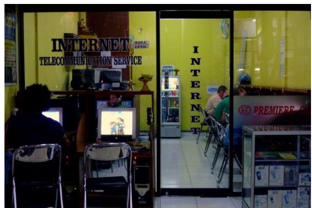
Ein Internet-Cafe auf der Insel Bali.

Personenbezogene Daten in Indonesien müssen dringend sofort und umfassend rechtlich geschützt werden. Indonesien ist eines der wenigen Länder der G20, das noch keine vollständige Gesetzgebung zu personenbezogenen Daten hat, die von einer unabhängigen Behörde überwacht wird. Auf rechtlicher Ebene wird der Schutz personenbezogener Daten kurz erwähnt im Gesetz Nr. 12/2005 über die Ratifizierung des