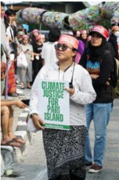
Die Insel Pari kämpft gegen den ansteigenden Meeresspiegel. Betroffene haben mit Walhi und anderen NGO-Partnern eine Zivilklage gegen den Schweizer Konzern Holcim eingereicht. Teilnehmerin bei der Aktionswoche für Umwelt 2023.

Tatsächlich gibt es Unternehmen, die über das Klima sprechen. Dabei geht es aber weniger um Klimapolitik oder die Bewältigung der Auswirkungen des Klimawandels, sondern vielmehr um Marketing und Werbezwecke. Auch in der internationalen Zusammenarbeit liegt ein Schwerpunkt auf der Förderung von Unternehmen bei Klimaschutzprojekten. Hierbei wird kein Fokus auf betroffene Gemeinden oder Gruppen gelegt. Es sind meistens Projekte wie Wiederaufforstung oder für Energie, jedoch oft ohne Mittel für betroffene Gemeinschaften. Dabei werden die Opfer des Klimawandels auf lokaler Ebene oft nicht unterstützt. Ihre Gemeinschaftsrechte (hak adat, Gewohnheitsrechte von Gemeinschaften) werden nicht berücksichtigt.