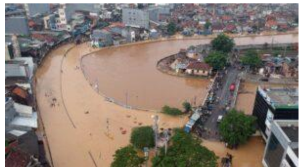
Eine von vielen Klimawandelfolgen: Überschwemmungen in Jakarta im Jahr 2018

Offensichtlich. Ein weiteres Beispiel sind Elektroautos. Der Fokus liegt auf der Automobilindustrie, und wie man durch den Aufbau der Infrastruktur Elektroautos produzieren kann. Das Ziel der Regierung ist also nicht, die Nutzung von Autos zu reduzieren. Dadurch werden vielmehr Fahrzeuge auf die Straße gebracht, anstatt in die Verbesserung des öffentlichen Nahverkehrs zu investieren, von der die breite Bevölkerung profitieren würde.