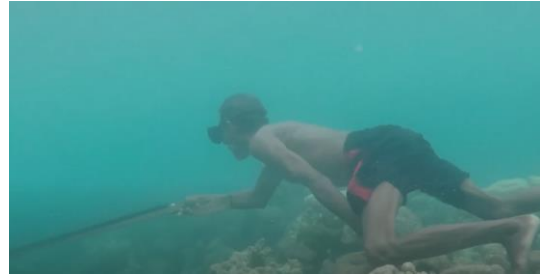
Die Bajau leben vom und mit dem Meer. Fische und weitere Meerestiere fangen sie auf traditionelle Weise mit Stöcken und Schlingen.