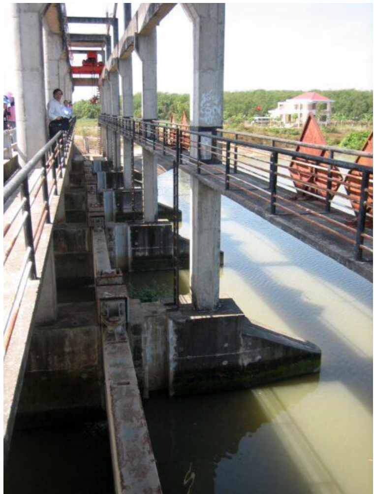
Wasserdurchfluss an einem künstlichen Wehr.

Zu den Hauptaufgaben gehören die ausreichende Versorgung mit Süßwasser sowohl in den salzwassergeprägten Gebieten mit Garnelenzucht als auch in den süßwassergeprägten landwirtschaftlichen Gebieten und ein wirksamer Gewässerschutz vor Verunreinigungen.