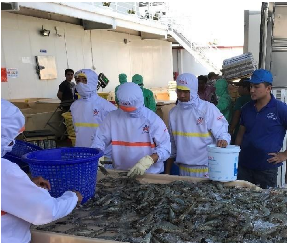
Garnelen werden von Hand sortiert.

Für die süßwassergeprägten landwirtschaftlichen Gebiete werden folgende Konzepte diskutiert oder bereits praktiziert: