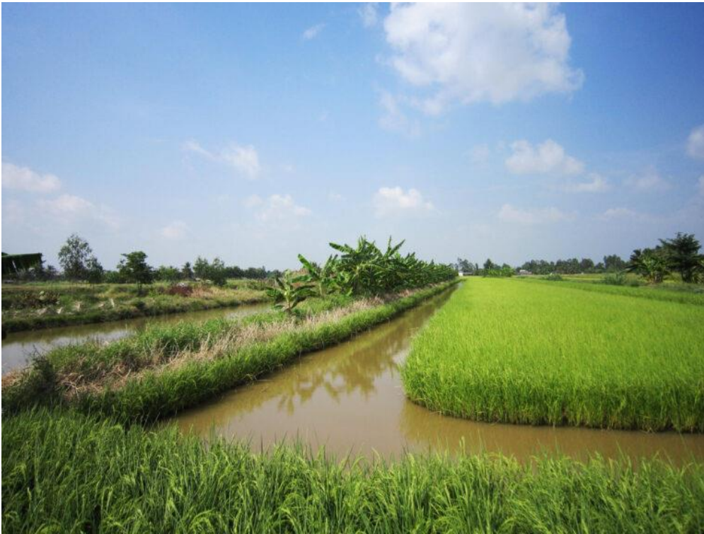
Reis- und Garnelen-Aquakultur im Mekong-Delta

Das komplexe System Mekong-Delta muss permanent koordiniert werden, damit es den unterschiedlichen Ansprüchen wie Süßwasserbedarf, Salzwasser-Zu- und Abflüsse, Trennung der Süßwasser- und Salzwasserbereiche, Erhaltung und Verbesserung der Oberflächenwasserqualität, Hochwasserschutz und Reaktion auf Extremereignisse genügt.