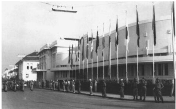
Das Konferenzgebäude Gedung Merdeka (Gebäude der Unabhängigkeit) in Bandung im Jahr 1955

Hinsichtlich der Tatsache, dass es noch immer Territorien gab, die unter kolonialer Kontrolle verblieben waren, erklärt das Kommuniqué der Konferenz, dass „Kolonialismus in allen seinen Manifestationen ein Übel ist, das so schnell wie möglich beseitigt werden muss“, und fordert die Selbstbestimmung und Unabhängigkeit Algeriens, Marokkos und Tunesiens von der französischen Herrschaft. Es war auch eine Erklärung uneingeschränkter Unterstützung für Palästina, was im Hinblick auf die jüngsten Ereignisse ebenfalls eine bedeutende Angelegenheit darstellt: „Angesichts der bestehenden Spannungen im Nahen Osten, verursacht durch die Situation in Palästina, und der daraus resultierenden Gefahr für den Weltfrieden erklärt die Asiatisch-Afrikanische Konferenz ihre Unterstützung für die Rechte des arabischen Volkes in Palästina und ruft zur Umsetzung der Resolutionen der Vereinten Nationen (UN) in Bezug auf Palästina sowie zur Erreichung einer friedlichen Lösung der Palästina-Frage auf.“