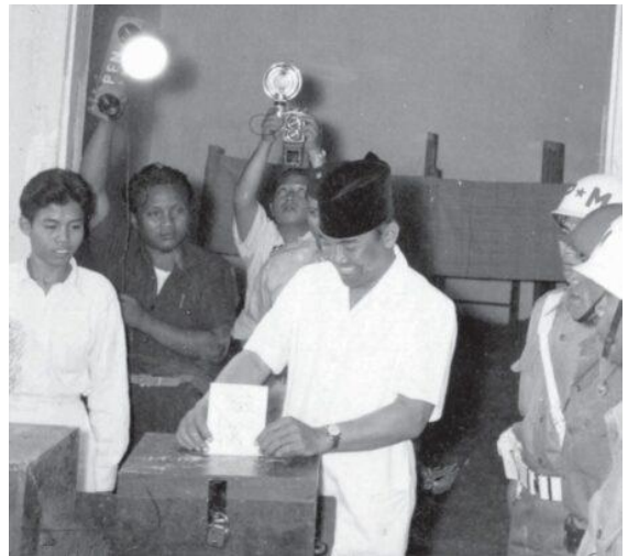
Präsident Sukarno bei der Stimmabgabe zu den Wahlen in Indonesien 1955

Asiatische Einheit und Solidarität waren ein Konzept und ein ansteckendes Gefühl. Sie vermochten die im Entstehen begriffenen postkolonialen Staatsgrenzen ebenso zu überwinden wie den Kalten Krieg, den die USA in Asien, insbesondere in Korea und Indochina, durchzusetzen versuchten. Die Bandung-Konferenz war nicht der Anfang, sondern der Höhepunkt eines Prozesses, der bereits Ende des 19. Jahrhunderts begonnen hatte und der weitergehen sollte.