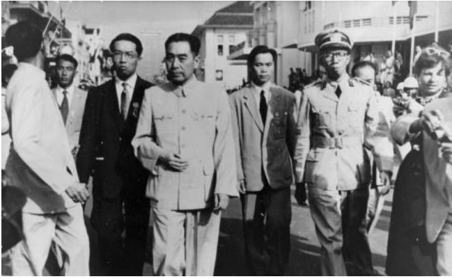
Chinas Premierminister Zhou Enlai (3.v.l.) mit Delegation der VR China bei der Bandung Konferenz 1955

In diesem Zusammenhang erinnere ich mich an die Konferenz der Liga gegen Imperialismus und Kolonialismus, die vor fast 30 Jahren in Brüssel stattfand. Auf dieser Konferenz trafen sich viele prominente Delegierte und fanden dort neue Kraft in ihrem Kampf für Unabhängigkeit. Dennoch war es ein tausende Kilometer entfernter Tagungsort, unter Fremden, in der Fremde. Nicht durch freie Wahl, sondern notgedrungen war man dort zusammengekommen.