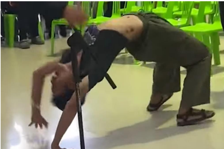
Jubelpose nach dem Ziehen der befreienden Karte.

Andererseits ist die vordergründige Unbeschwertheit der Veranstaltung für das thailändische Militär strategisch vorteilhaft, da sie die Gewalt verschleiert, die hinter verschlossenen Türen stattfindet, sobald die Wehrpflichtigen eingezogen wurden. Dies erklärt, warum Soldaten bereitwillig an den Späßen der potenziellen Rekruten teilnehmen.