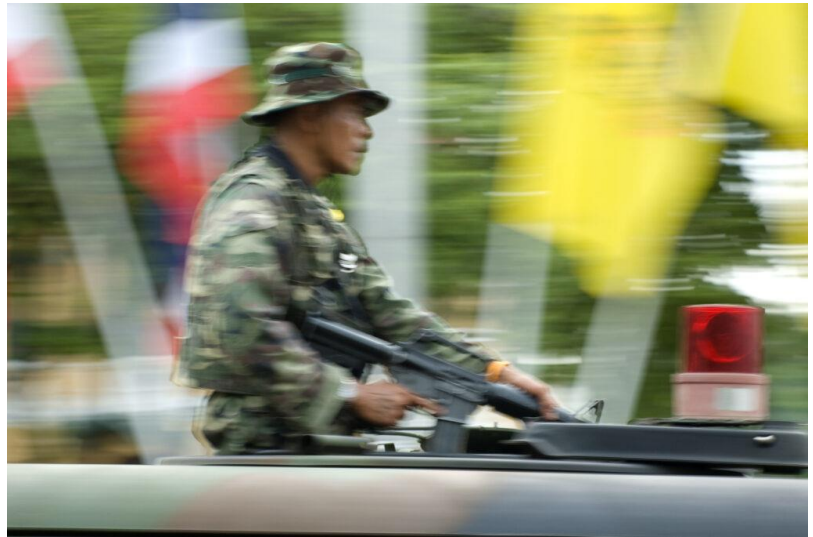
Das Militär ist in Thailand ein wichtiger gesellschaftlicher Faktor.

Die Folgen der Nichtteilnahme an der Auslosung sind drastisch: Wehrdienstverweigerer müssen mit bis zu drei Jahren Haft rechnen. Die Struktur der Wehrpflicht, die zwischen Freiwilligen und Wehrdienstverweigerern unterscheidet, führt dazu, dass sich diejenigen, die dem Militär nahestehen und damit höchstwahrscheinlich einem vom Militär verkörperten Männlichkeitsideal entsprechen, in der Regel freiwillig melden.