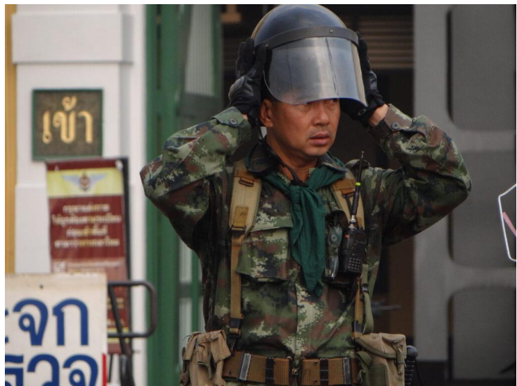
Militarische Männlichkeiten betonen oft körperliche Härte.

Die Zeremonie beginnt üblicherweise damit, dass ein potenzieller Rekrut auf die Urne mit den Karten zugeht. Dieser Gang ist der erste Moment, in dem er seine Persönlichkeit, Identität und Gefühle zum Ausdruck bringen kann. Manche schreiten selbstbewusst und trotzig mit erhobenem Kopf auf die Urne zu, andere hüpfen, tanzen oder wirbeln herum. Auch wenn diese Rekruten in der Regel keine offenkundig feminine Kleidung tragen (zum Beispiel Röcke, Kleider oder lange Haare), tragen viele von ihnen mindestens ein Accessoire, das ihre Abkehr vom traditionellen Männerbild signalisiert: eine Handtasche, Haarschmuck oder ein hochgezogenes Hemd, das den Bauchnabel freilegt.