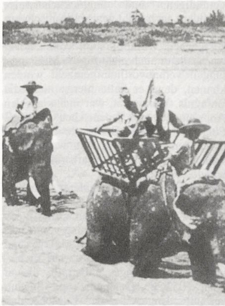
Einsatz von Elefanten beim japanischen Vormarsch in Burma