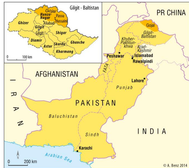
Abb. 1: Karte von Gojal und Gilgit-Baltistan

wirtschaftliche Nutzungen nur in den Tallagen mit Hilfe intensiver, Gletscher gespeister Bewässerung sowie eine saisonale Hochweidenutzung.