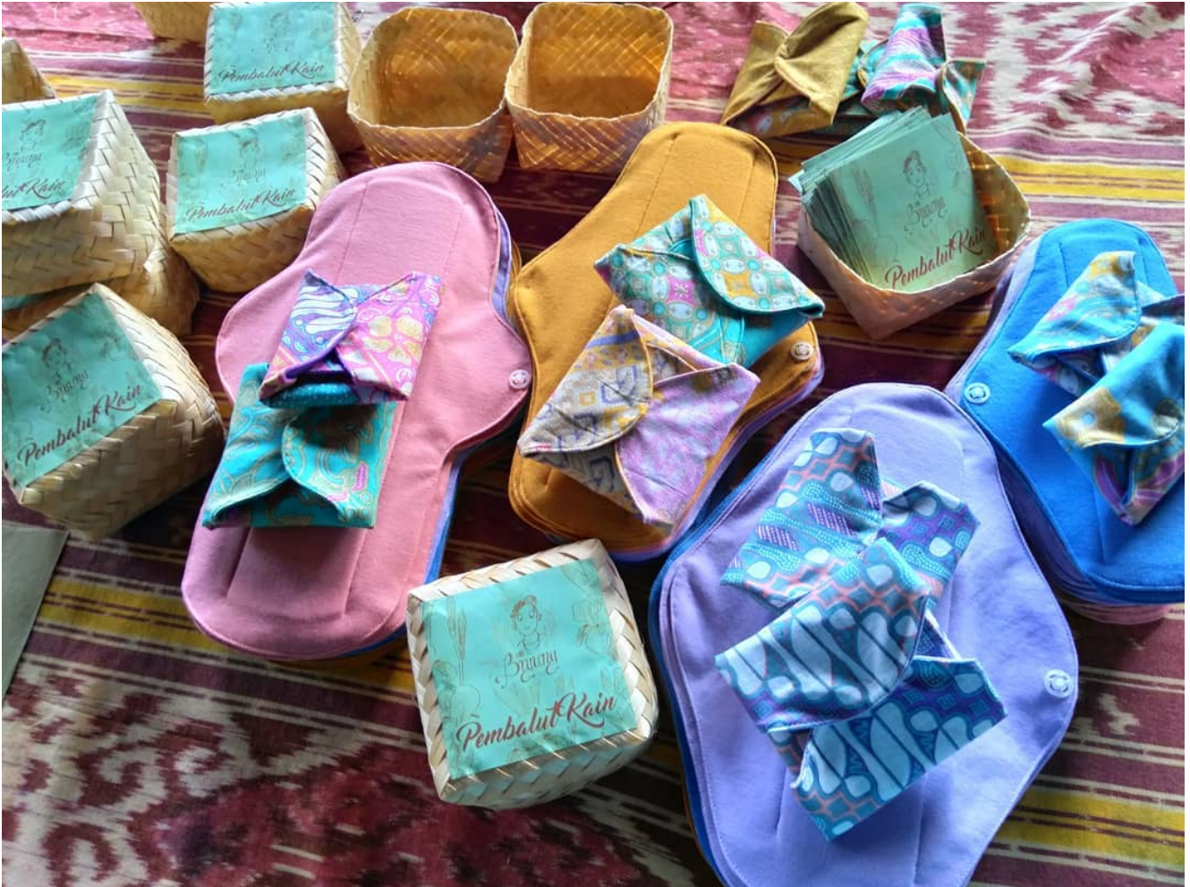
Monatsbinden aus Stoff

Nähmaschinen hatten wir auch. Wir experimentierten also mit verschiedenen Stoffen für Hülle und Füllung von Stoffbinden, nähten drauf los und probierten das Ergebnis an uns und unseren Freundinnen aus. Daraus entstanden viele Diskussionen und schließlich die Workshops.