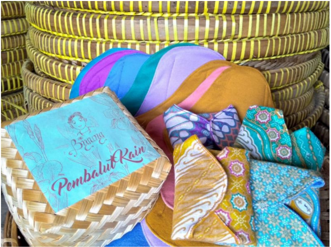
Monatsbinden aus Stoff