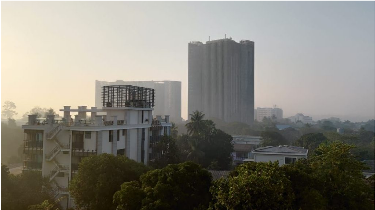
Morgendlicher Smog über den Dächern Yangons

Anpassungsmaßnahmen. Der direkte Zugang zu internationalen Klimatöpfen durch nationale Einrichtungen ist gerade für die am meisten betroffenen Länder extrem begrenzt.