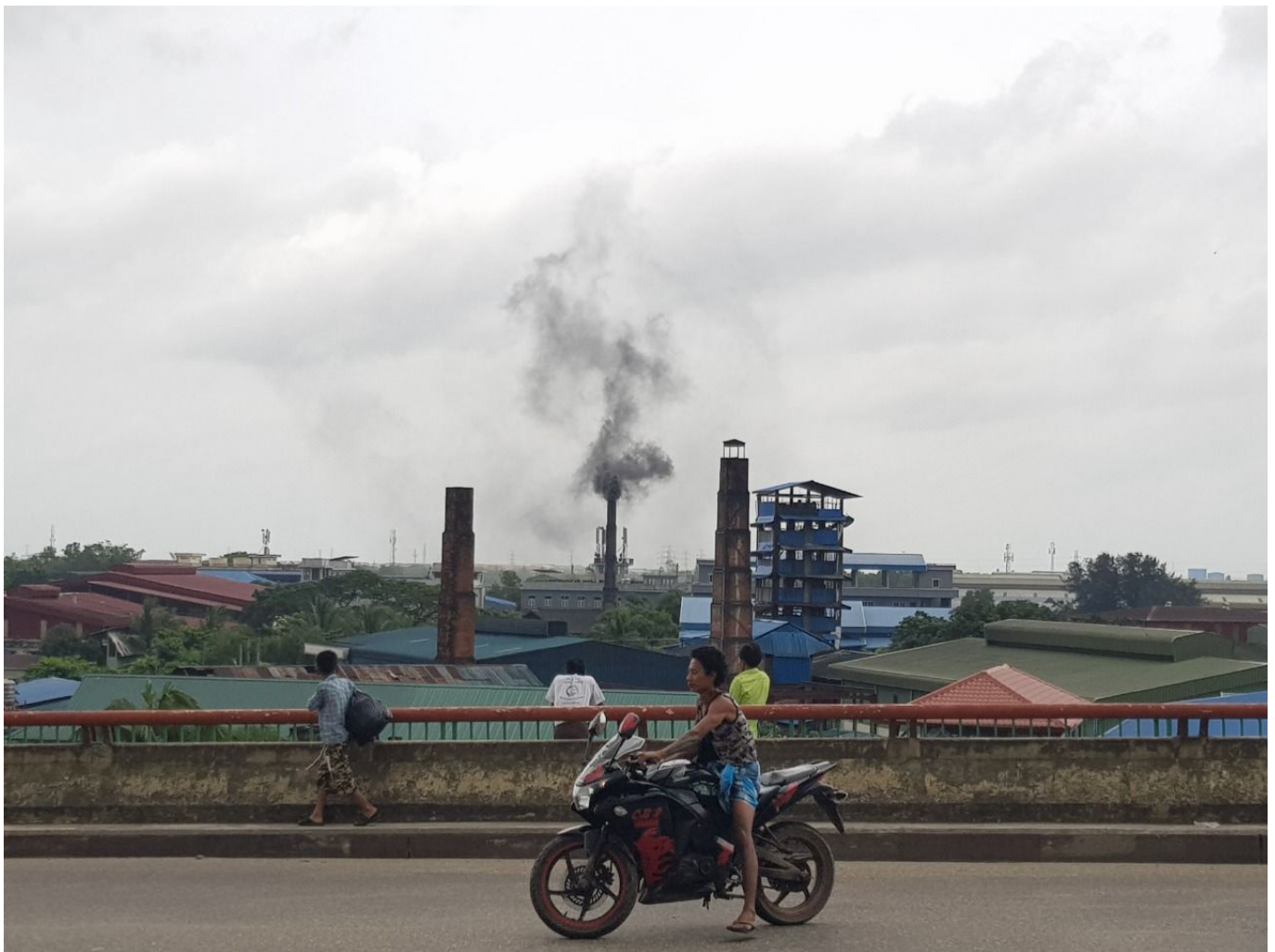
Industrielle Kohlenutzung in Yangon

Myanmar: Naturkatastrophen der letzten zwei Jahrzehnte zeigen die Sensibilität des Landes für die Folgen des Klimawandels. Die Regierung will den Weg zu einer klimaresistenten und kohlenstoffarmen Gesellschaft ebnen, setzt jedoch weiterhin auf Kohle zur Energieversorgung.