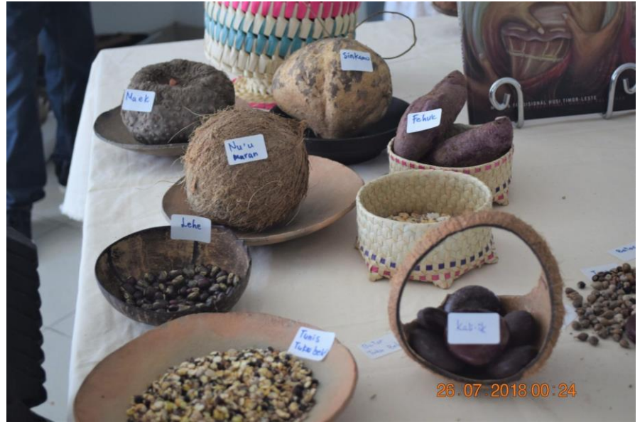
Überlebensnahrung oder „revolutionäre“ Lebensmittel, die in Timor-Leste zu Zeiten des Einmarschs und der Kolonisierung durch Portugal, Japan und Indonesien gegessen wurden.

Der Botschafter der Europäischen Union in Timor-Leste, Andrew Jacobs, erklärte, dass „viele Kinder nicht das nahrhafte Essen und die Gesundheitsfürsorge erhalten, die sie brauchen“. Dies schadet nicht nur den Kindern selbst, sondern hat auch negative Auswirkungen auf die Gesellschaft“ (Antonio Sampaio 2020, Timorese government starts research on food and nutrition in the country , Antonio Sampaio (Lusa), 3 June, retrieved 18 June 2020).