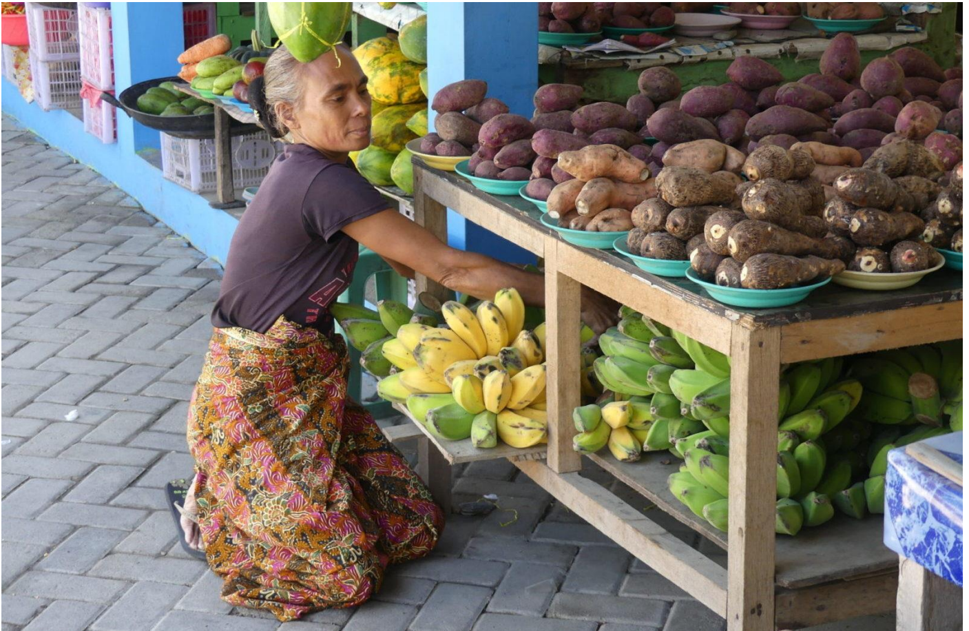
Marktstand in der Hauptstadt Dili

Osttimor, oder Timor-Leste, ist ein abgelegenes Land in Südostasien. Auf eine fast 500 Jahre dauernde Kolonisation durch Portugal folgten 24 Jahre brutaler militärischer Besetzung durch Indonesien. Nicht zuletzt dank der weltweiten solidarischen Unterstützung wurde Timor-Leste am 20. Mai 2002 eine unabhängige Nation. Doch die junge Nation war schwer gezeichnet: rund 180.000 Menschen waren an den Folgen des Krieges gestorben und etwa 80 Prozent der Infrastruktur des Landes wurden beim Rückzug Indonesiens 1999 zerstört.