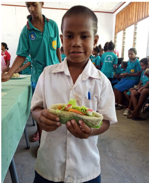
Die neuen nahrhaften und köstlichen Gerichte kommen gut an

Gemeinschaften selbst angegangen. Was sie essen und wie sie nahrhafte Mahlzeiten zubereiten können, um ihre Kinder gut zu ernähren, wird als ein wichtiges Thema angesehen. Wenn Kinder nicht mit ausreichend Nährstoffen versorgt werden, so hat das gravierende Folgen. Gemeinsam mit der Regierung führen NGOs und Ernährungsprogramme, die in den lokalen Gemeinschaften angesiedelt sind, durch. Die Programme, die auf lokale Nahrungsmittel setzten, sind die vielversprechendsten. All diese Beiträge haben bedeutende Veränderungen in den Gemeinden bewirkt. Jedes Jahr sinkt die Rate der Unterernährung um 1 bis 2 Prozent. Einige der Programme haben Ernährungslücken geschlossen und einige Gemeinden haben bereits die Ernährungsgewohnheiten ihrer Kinder verbessert.