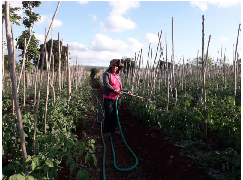
Landwirtin bewässert Kulturen in der äußeren Schicht von Mamar

Da die rechtlich-rationale Autorität (Dorfverwaltung) in Ponain traditionelle Gesetze ausschließt, werden Heiratszeremonien und das System der Landnutzungsänderungen immer einfacher. Früher verlangte das traditionelle Gesetz von den jungen Brautleuten, 50 Bäume im Mamar -Gebiet zu pflanzen. In anderen Fällen wurden Sicherheiten für die Änderung der Landnutzung verlangt.