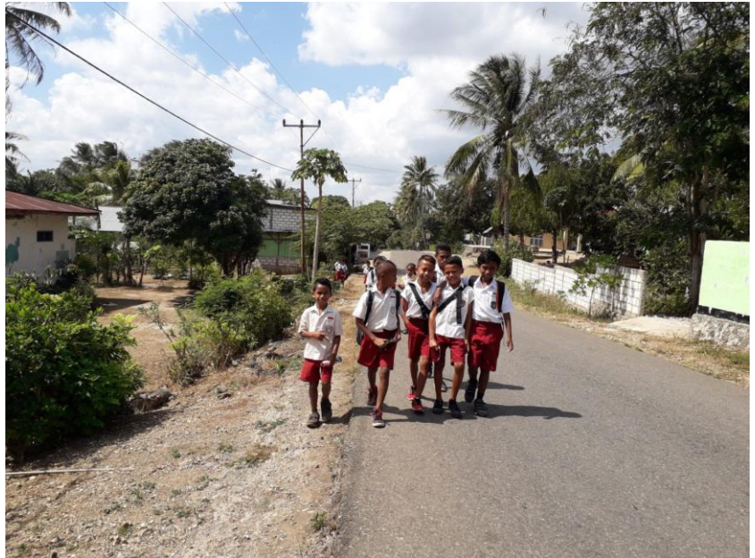
Schüler*innen gehen im Dorf Ponain zur Schule

Außerdem gibt es Vorurteile, dass die Landwirtschaft keine ‚richtige‘ Einkommen schaffende Tätigkeit sei, da lokale Landwirt*innen von Subsistenzwirtschaft leben und die städtischen Arbeitsplätze mehr Geld bieten würden. Das Durchschnittsalter der Bäuer*innen im Dorf Ponain liegt bei 50 bis 60 Jahren. Entsprechend ist die Landwirtschaft gefährdet. Die Jugendlichen in Ponain sind sich dem bewusst und entscheiden sich trotzdem, aus dem Dorf wegzuziehen.