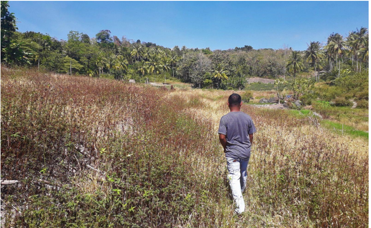
Ein Dorfbewohner im Mamar-Gebiet auf der Insel Timor (Westtimor) in Indonesien

Mamar – hinter dem klangvollen Namen verbirgt sich ein altes und bis heute wirksames landwirtschaftliches und kulturelles System. Das Mamar -System im Dorf Ponain wurde Ende des 18. Jahrhunderts errichtet, als das Königreich Koroh noch existierte, bevor es 1945 zusammen mit anderen lokalen Königreichen des Archipels in die Republik Indonesien eingegliedert wurde. Bis 1968, als ein neues Gesetz über die Dorfverwaltung in Indonesien verabschiedet wurde, umfasste das Königreich Koroh drei Dörfer im Großraum Ponain. Bis in die 1990er Jahre war das Mamar -System die Haupteinnahmequelle der Dorfbewohner*innen.