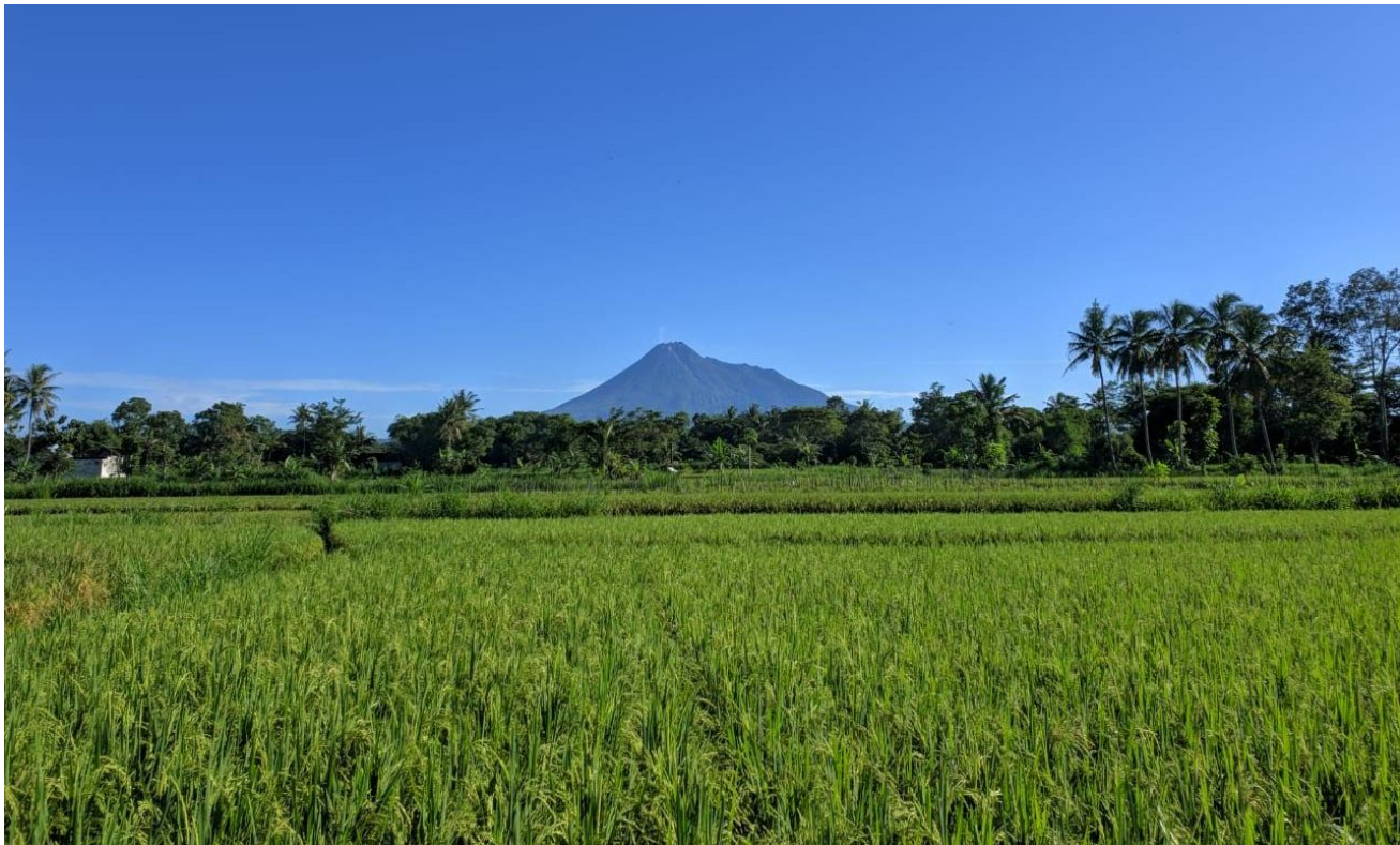
Reisfeld bei Yogyakarta

Sogar nach der Islamisierung, die Anfang des 17. Jahrhunderts die gesamte Halbinsel massiv erfasste, bleibt die Verehrung von Sangiang Serri für die Menschen in Südsulawesi prominent. Im 17. Jahrhundert stellte ein Bericht während einer holländischen Militärexpedition in Südsulawesi fest, dass das Volk der Buginesen es in Kriegszeiten vermeidet, Reisfelder abzubrennen , da sie den Zorn von Sangiang Serri fürchten.